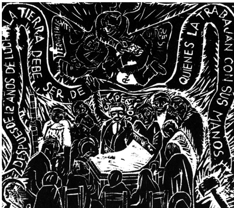
Xavier Guerrero, El Machete , 1924.

germanoparlante, el autor quiere demostrar con dos ejemplos de pensadores de la llamada “periferia” lo absurdo, mediocre e irracional de la pretensión europea y alemana de ser el centro intelectual del mundo. Gandler menciona que su trabajo en México provocó en él un cambio radical de conciencia y, a la vez, una crítica al eurocentrismo. Él está convencido de que el eurocentrismo filosófico es una de las razones principales del desastre que vive la humanidad a nivel mundial. El libro, desde esta óptica, busca darle voz a los que no son escuchados y tienen derecho a serlo. Los pensadores y pensadoras del llamado Tercer Mundo tienen el derecho a ser escuchados por los académicos de los “centros” del saber y no sola-