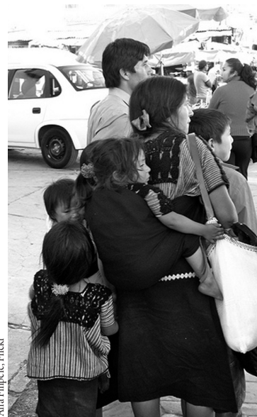
Ana Filipovic, Flickr