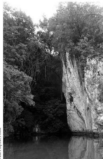
Ana Filipovic, Flickr

La idea de una acción pragmática orientada por intereses principalmente materiales viene completada por la noción de “equivalentes funcionales”, tomada de Niklas Luhmann. La intención de este préstamo es obvia. Consolida la presentación del EZLN (y de otros actores) como “agentes externos” a las comunidades y permite reducir su “propuesta discursiva” a una “cuestión secundaria” para los indígenas, mientras lo único que les importaría sería la fuerza organizativa disponible para la consecución de sus propios objetivos. Mientras este “aparato teórico” se despliega para ocupar los últimos párrafos del libro, las convicciones de los actores del movimiento zapatista quedan arrinconadas en una escueta nota de pie de página (p. 432). En este punto, incluso la referencia “microhistórica” termina cargada de implicaciones discutibles ya que, si bien menciona la necesidad de articular los niveles nacional y local, Estrada afirma que las opciones de los actores deben comprenderse esencialmente a partir de los “intereses y conflictos muy puntuales que sólo se entienden en su lógica de operación y significado en el nivel local”, mientras las intervenciones foráneas sirven de “lenguajes” que los actores se apropian para “configura[r]”, en términos pragmáticos, “identidades políticas plásticas”, instrumentalizadas en el marco de los conflictos y las situaciones locales. Además de encerrar el sentido de la acción so-