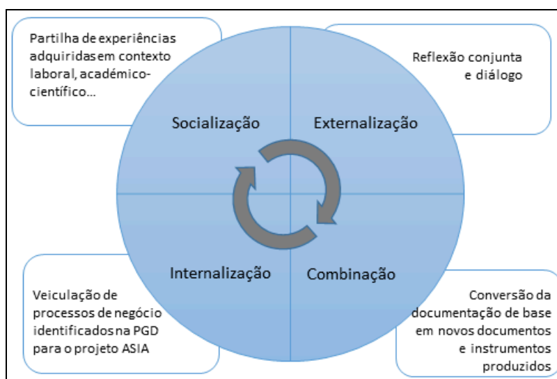
Figura 1. Modelo SECI (Nonaka, 1994) adaptado