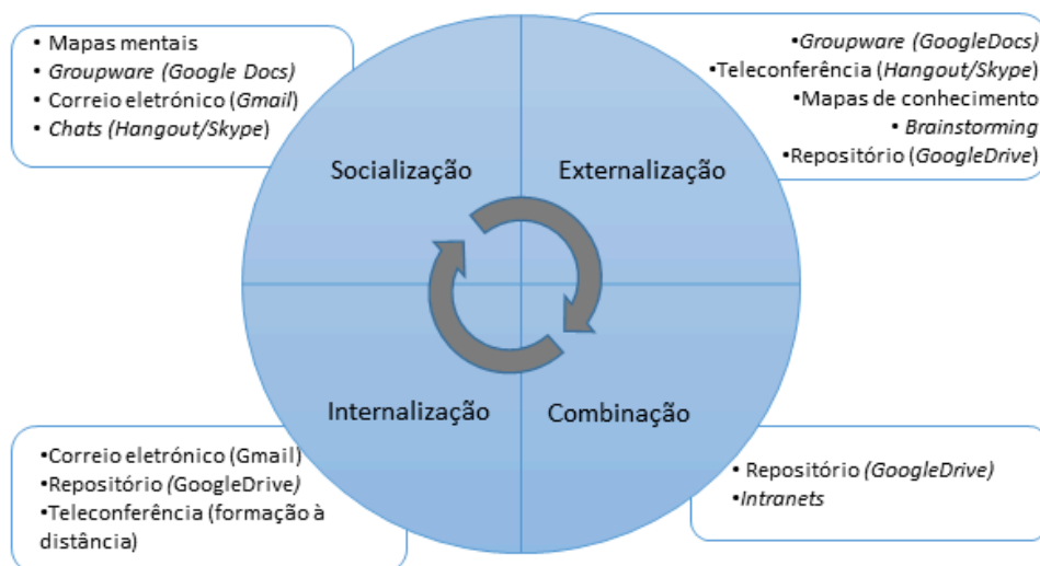
Figura 4. Integração das ferramentas de apoio à Gestão do Conhecimento utilizados no âmbito do projeto GT-IES no Modelo SECI