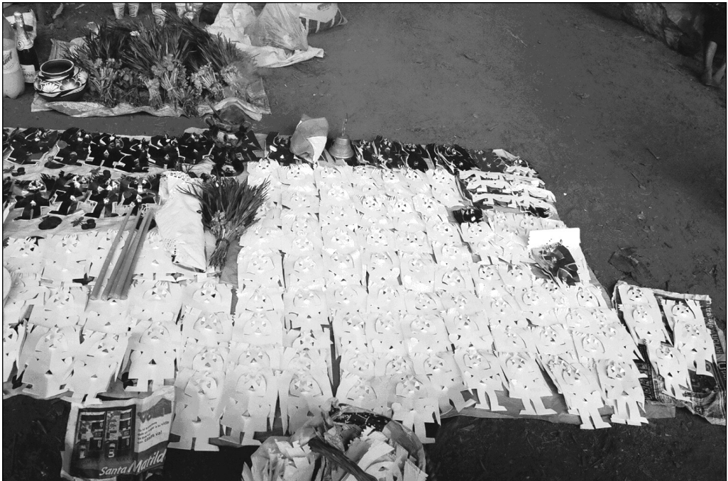
Fig. 7 Las potencias. Localidad de Píe del Cerro.

Todas las ceremonias son llevadas a cabo por especialistas llamados en otomí bādi’na (‘el que sabe’). Este recorta cientos de figuras antropomorfas en papel china, jonote y bond, que son consideradas como “la fuerza” de las potencias. Hacen grandes “camas” de muñecos recortados, algunas de las figuras se visten y depositan en las cuevas y grutas, otras en el “monte” en los montículos prehispánicos y en el fogón casero. Existen características específicas para cada una de las figuras, se colocan de cierta forma, número y por importancia, se les da de fumar, beber y comer, además a algunas de ellas se las sacraliza con la sangre de pollos; se las activa abriendo los pequeños agujeros que contiene cada muñeco (Fig. 7) 37 .