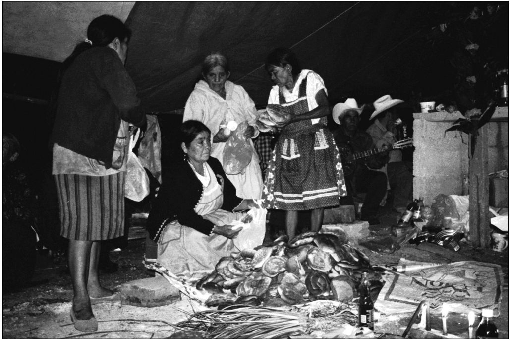
Fig. 8 La Ofrenda. Localidad de San Juan.

A estas figuras llamadas nzaki se les rinde culto en los rituales y se les deposita ofrendas que se denomina con el término otomí de 'bóts'e que se traduce como ofrecimiento y sacrificio. Las figuras 'del mundo de los muertos' constituyen una "cama" que después se convierte en 'bulto' llamado tönts'i'na o la limpia, este 'bulto' es depositado en el "monte" en los cerros donde se dice que habita Zithü'na . También se hacen figuras de papel recortado para curar enfermedades, para realizar brujería y para regresar el ndähi del individuo que dejó en algún lugar donde sufrió de un susto, se cayó o tuvo algún accidente (Fig. 8) 38 .