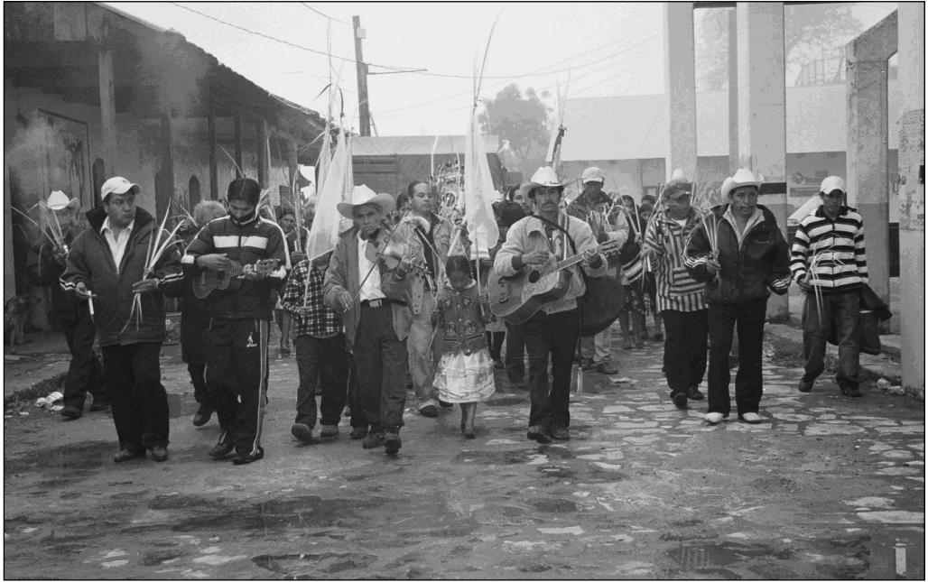
Fig. 10 Mayordomos para el Costumbre de La Campana. Localidad de Tutotepec.

mo, los mayordomos para “el costumbre” de la campana en Tutotepec se eligen dos años antes y empiezan a tener obligaciones desde este momento (Fig. 10) 48 .