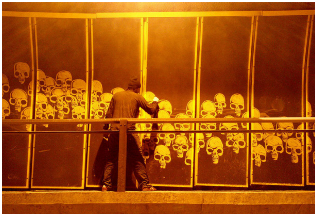
Imagem 4- Obra "Ossário" no túnel Max Feffer- São Paulo Autor: OSSARIO@ 2006 ALEXANDRE ORION

A sujeira invisível, que se evidencia somente no momento da limpeza, é de ordem ambiental, social e política. (imagem 4)