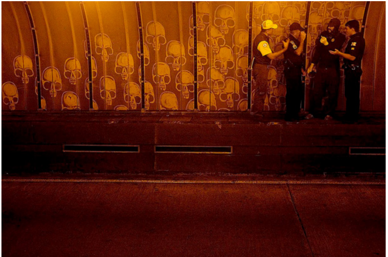
Imagem 3- Agentes da prefeitura limpando a intervenção no túnel Fonte: http://www.alexandreorion.com/ Autor: OSSARIO@ 2006 ALEXANDRE ORION

Orion inicialmente desenhou em 160 metros, porém a prefeitura acionou a limpeza que lavou apenas os trechos desenhados. Então o artista desenhou mais 140 metros, o que levou à limpeza total do túnel. A prefeitura, até o momento, não havia feito a limpeza do túnel. A ação não durou 24 horas, pois a higienização foi realizada na mesma noite em que o artista iniciou sua atuação (imagem 3). Sua provocação, leva a realização de uma ação que já deveria ter acontecido no túnel. É neste instante que a ação é concluída.