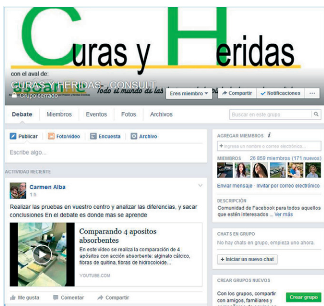
Imagen 2 - CURAS Y HERIDAS https://www.facebook.com/groups/curasyheridas