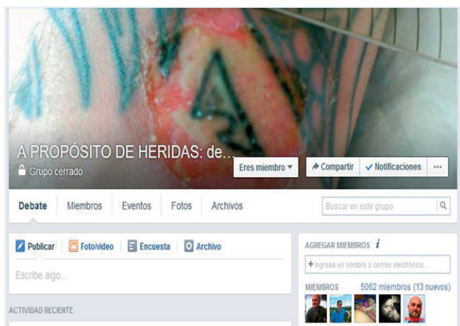
Imagen 1 - A PROPÓSITO DE HERIDAS: Debates y casos clínicos https://www.facebook.com/groups/heridasyapositos/