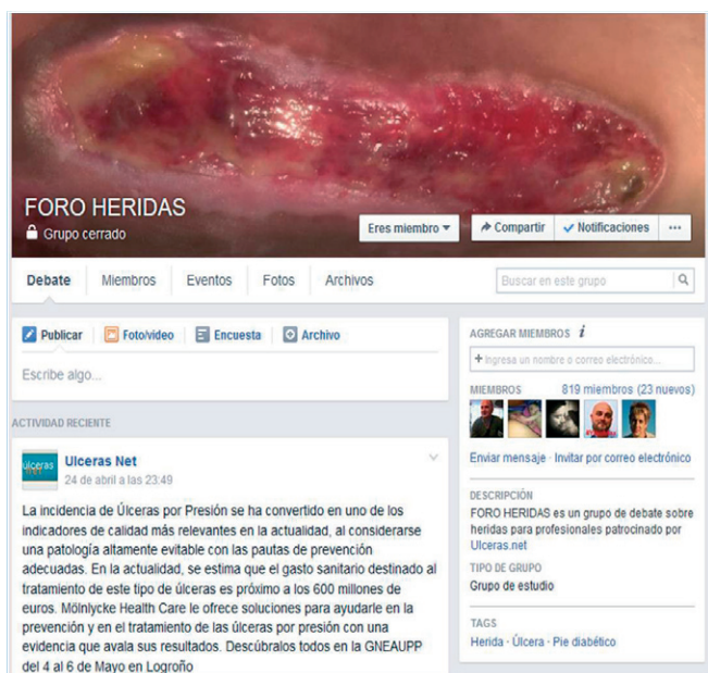
Imagen 3

Es preciso hacer una especial reflexión sobre esta práctica, ya que aunque este tipo de recomendaciones inadecuadas, pueden ser llevadas a cabo sin mala intención, derivadas de lo que, entre profesionales sanitarios, conocemos como: “Técnica AMIME” ( “a mí me va bien” ), pero también podrían ser debidas a otras causas menos desinteresadas y peor intencionadas; pero en todo caso, se trata siempre, de una práctica cuestionable, que deberíamos tratar de erradicar.