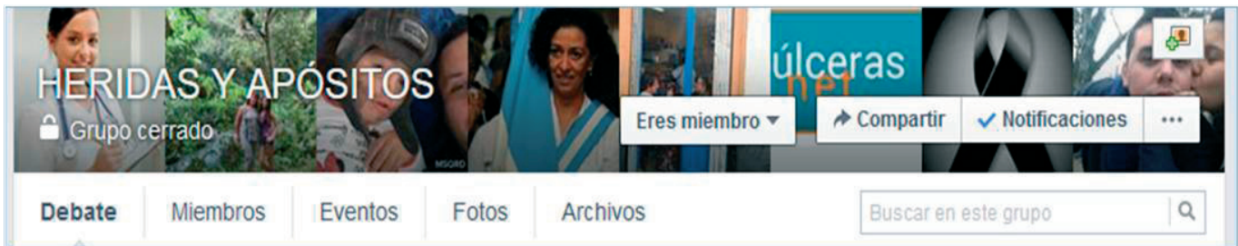
Imagen 4 - HERIDAS Y APÓSITOS https://www.facebook.com/groups/383255188522953/