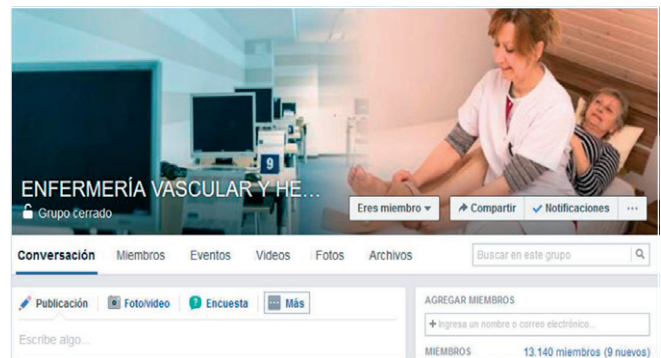
Imagen 5 - ENFERMERÍA VASCULAR Y HERIDAS - AEEVH https://www.facebook.com/groups/490430667766825/