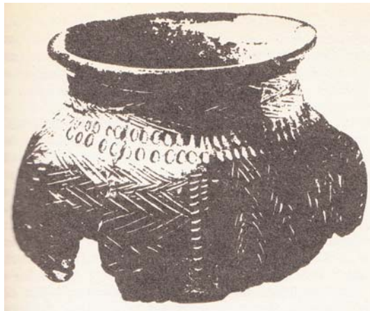
Figura 3: EExemple de cultura material de Valdivia: ceràmica decorada amb marques realitzades amb blat de moro. Una de les primeres proves d’activitat agrícola relacionada amb aquesta cultura (Baumann, 1985: 67).

la tècnica avançada i la complexitat dels dissenys, fet que ja passa amb l’anomenada Fase San Pedro. Com recull Staller (2001: 215) dels treballs de Latharp et. al. (1975: 27-33), la ceràmica es pot dividir en dos tipus, els bols oberts i les gerres de coll prim, i s’associa amb diferents fases segons la decoració. A la primera fase trobam decoracions fetes amb incisions geomètriques, amb algunes peces mostrant evidències d’ús culinari. A la segona fase apareixen formes més variades, destacant-hi bols grans amb quatre suports. Entre les fases III i V, hi ha un gran augment en la complexitat tant de formes com de motius decoratius, apareixen els colors i les figures antropomòrfiques. Cap al període més tardà s’arriba al nivell màxim de complexitat i innovació tecnològica amb una gran varietat tipològica amb una certa variació regional (Staller, 2001: 215-222). (figura:3)