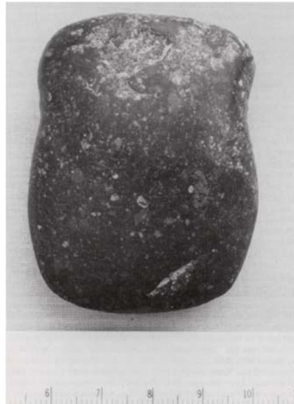
Figura 2: Exemple de cultura material de Las Vegas: destal de pedra pulimentada. (Stothert, 1985: 623)

623). De copinyes es troben instruments utilitzats com a "culleres", objectes que es trobaran de forma idèntica associats a la Cultura Valdivia (Stothert, 1985: 634). En qualsevol cas, el cert és que la conservació de cultura material de la Cultura Las Vegas és molt limitada. És un fet que Stothert (1985) atribueix a processos d'erosió. (figura:2)