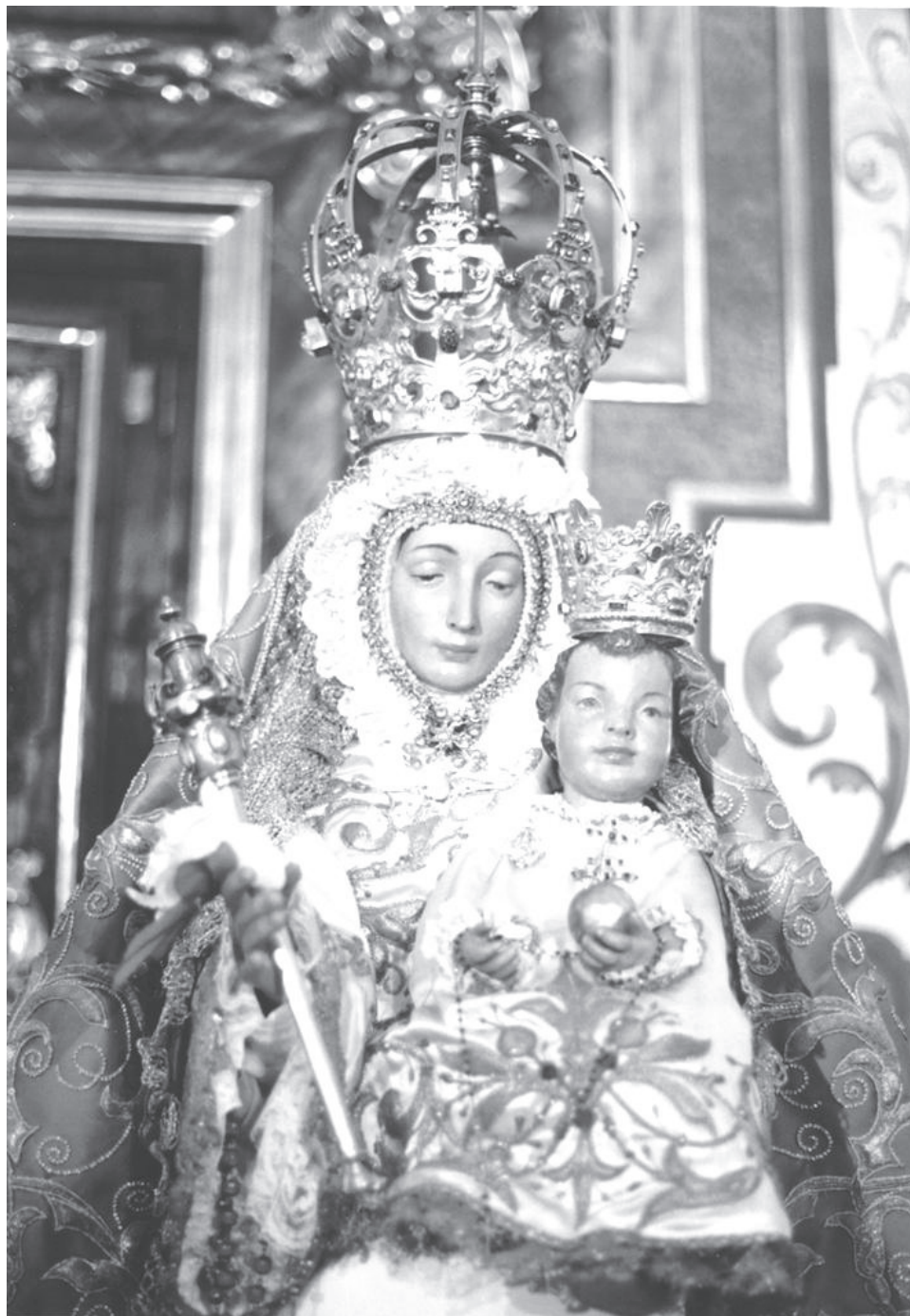
La Virgen de la Cabeza