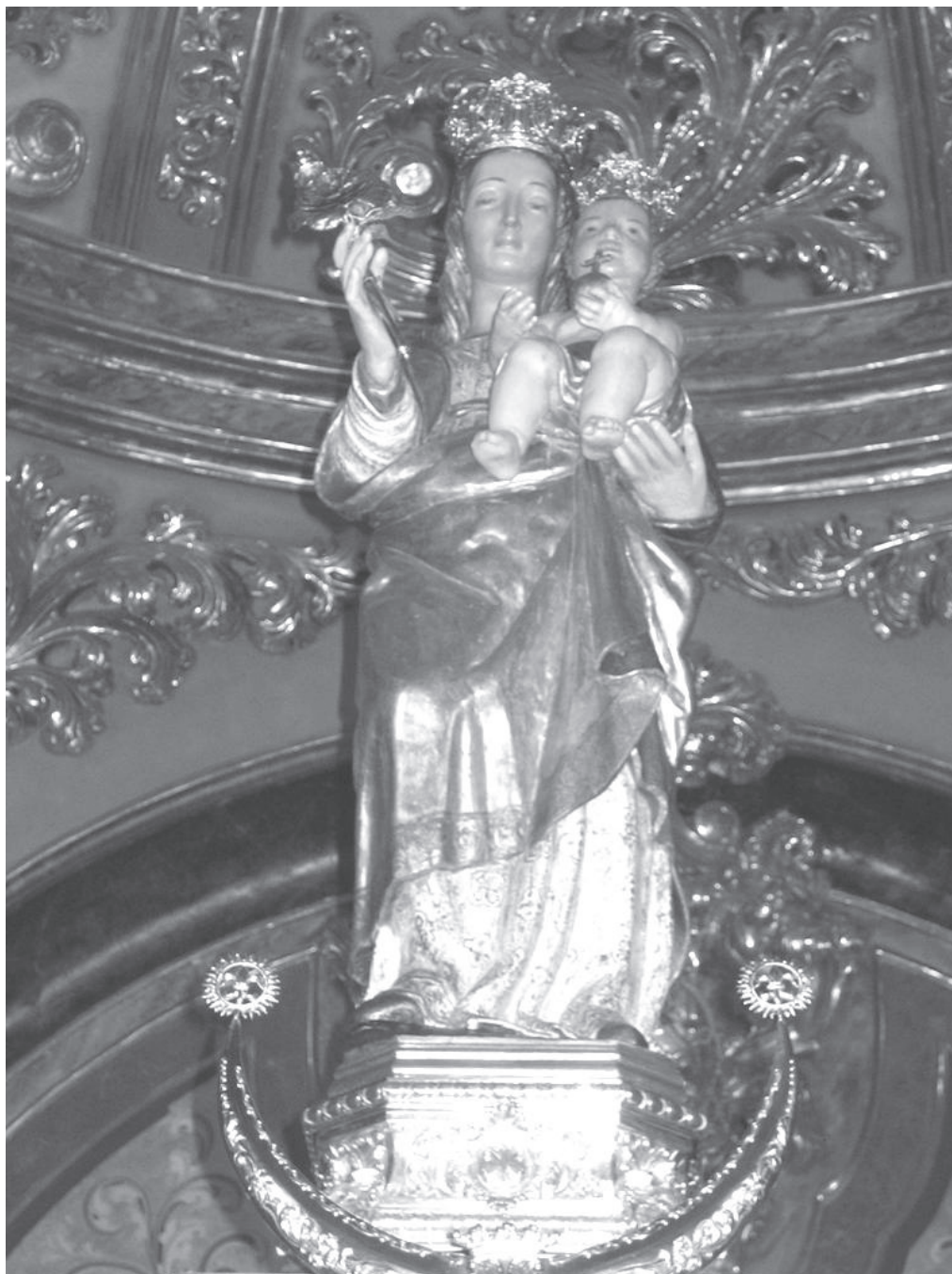
La Virgen de la Cabeza en su camarín