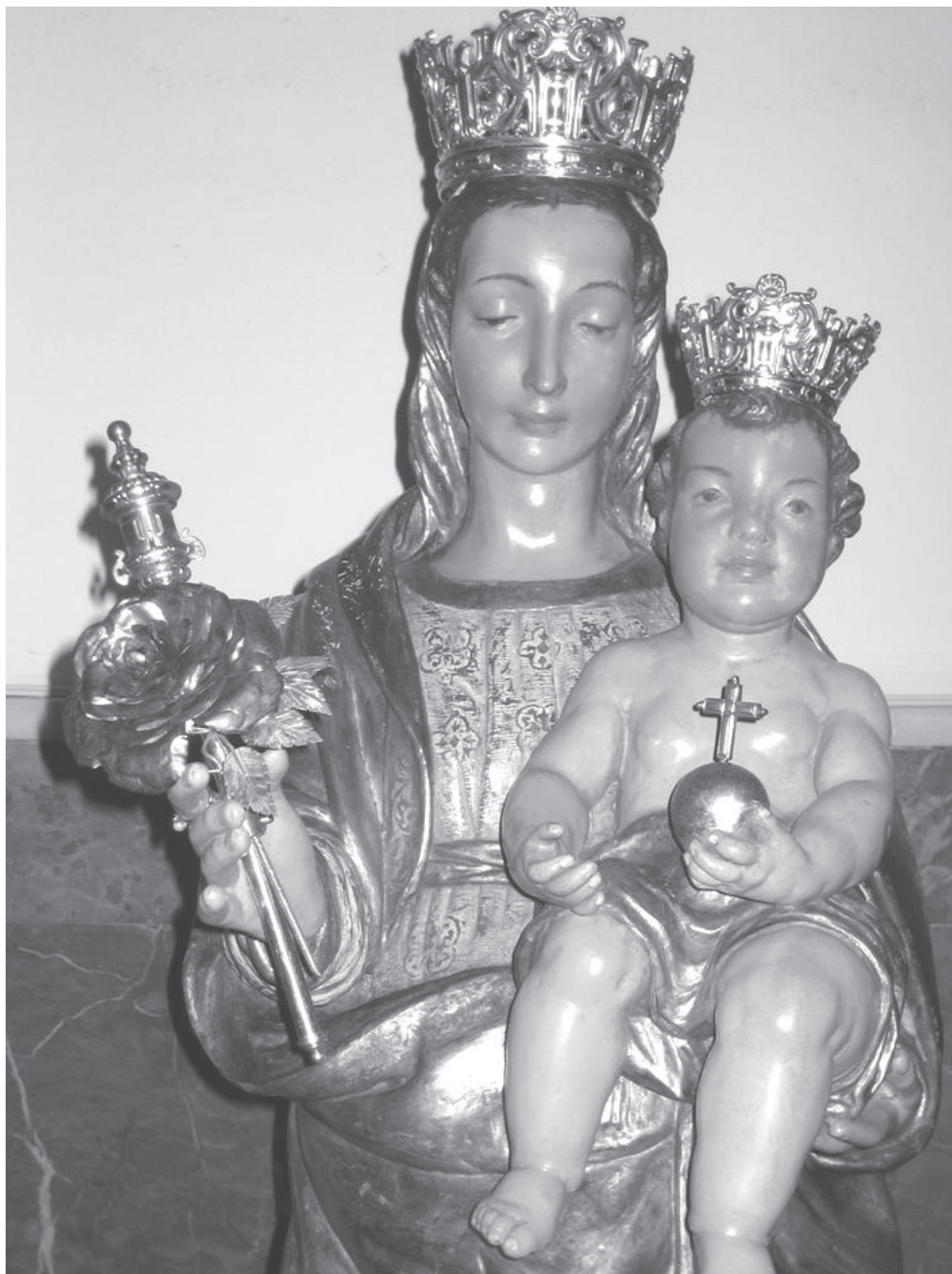
La imagen en su talla original