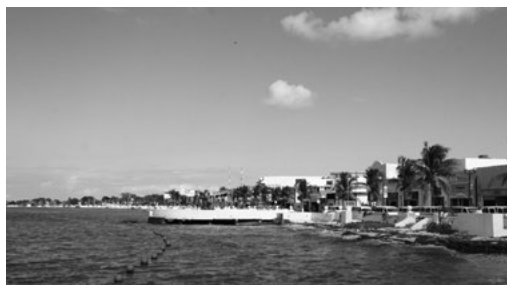
Imagen 3. Malecón Costero Norte, 2013.