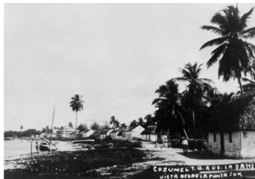
Imagen 2. Mercantilización de la naturaleza.

y servicios ambientales con la finalidad de insertarla en los procesos productivos propios del mercado, tales como la creación de los bonos de carbono. Killeen (2007) plasma esta idea con lo que sucede en la Amazonia, donde se crearon áreas naturales protegidas complementadas con reservas indígenas enfocadas a la captación de ingresos económicos a partir del pago de servicios ambientales para subvencionar el crecimiento económico de la región. Así, la naturaleza se anexa a la suma de bienes y servicios al interior de los sistemas económicos (Smith, 1990), toda vez que los recursos se encontraban fuera del mercado y el modo de producción se apropia de ellos, lo que Harvey (2004) denomina acumulación por desposesión.