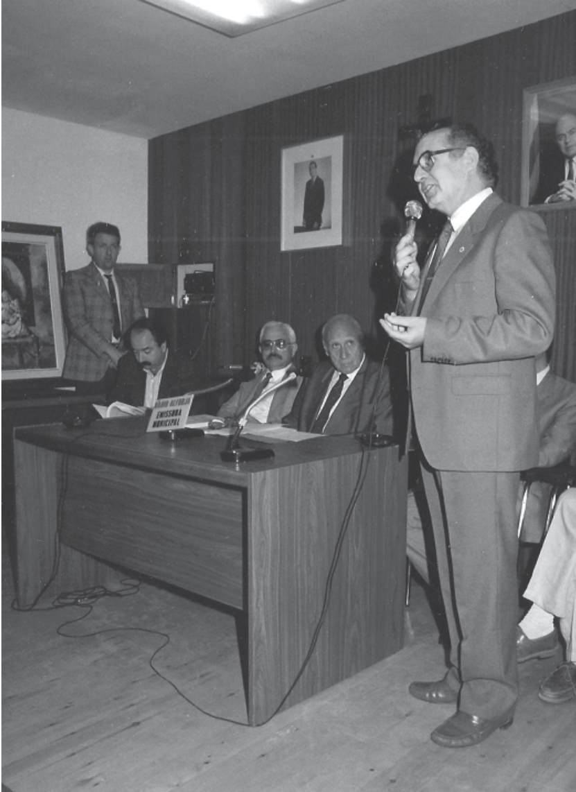
Presentació d' Història d'Alforja l'any 1986.