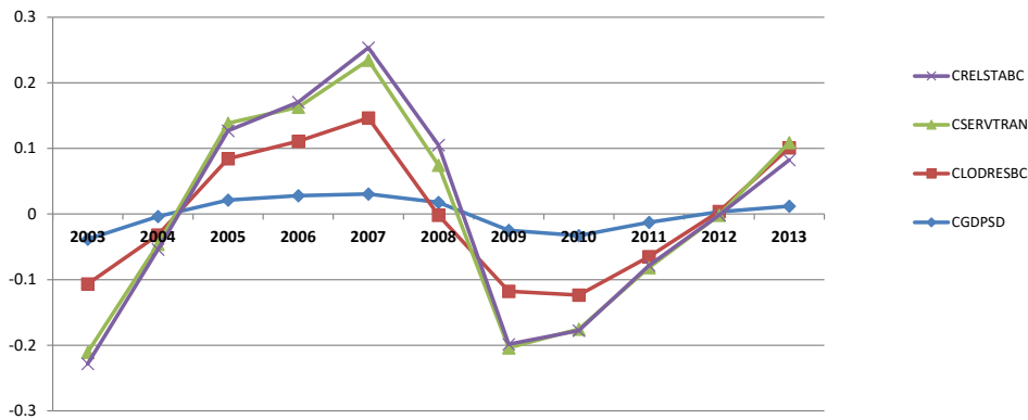
Figura 1: Componentes cíclicos del PIB de San Diego y subsectores económicos de Baja California, 2003-2013

Nota: CGDPSD=GDP(PIB) de San Diego, CRELSTABC=real estate subsector of Baja California (subsector de bienes raíces de Baja California), CSERVTRAN= transport subsector of Baja California (subsector de transporte de Baja California), CLODRESBC=lodging and restaurant services subsectors of Baja California (subsectores de hotelería y restaurantes de Baja California).