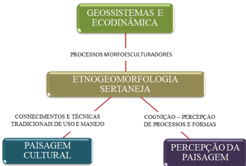
Figura 2 – Tríade conceitual utilizada nos estudos de Etnogeomorfologia.

A partir desta combinação de pontos de vistas sobre a paisagem (a tríade Geossistema-Cultura-Percepção), Ribeiro (2012) delineia um método baseado nos estudos