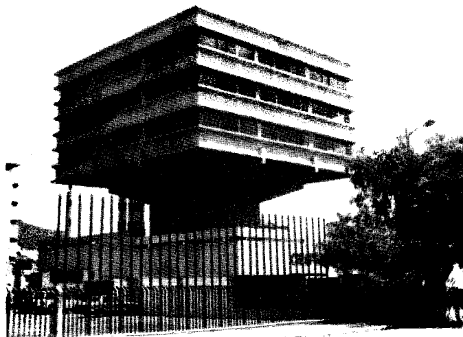
Edificio de Ciespal, sede de los cursos y seminarios

En el último lustro y por sensibilidad al proceso político histórico de la región, crisis social y económica en gran parte efecto de la crisis mundial del sistema, Ciespal estimó conveniente dar prioridad a áreas orientadas a los procesos de cambio social y bajo esta perspectiva su actividad se dirigió a cursos, talleres, asesorías y seminarios sobre diseños de proyectos específicos de comunicación, planificación e investigación de la comunicación, educación no formal, educación a distancia a través de la radio, preparación de mensajes para difusión de la ciencia y tecnología y de la defensa e integridad cultural●