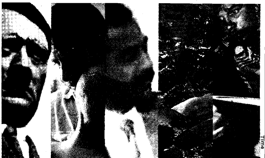
Los medios de comunicación "escriben" la historia

Entre el 2 y 4 de febrero de 1991, se realizaron entrevistas telefónicas a una muestra escogida al azar de 250 personas adultas, en el área metropoli-