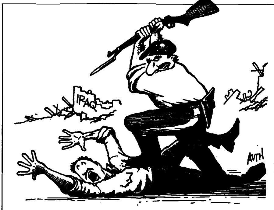
The Miami Herald

Los que critican la política de guerra, dicen que Estados Unidos es hipócrita cuando reacciona con tanta violencia ante una ocupación en el Medio Oriente, mientras ignora o apoya otras en la misma región. En términos de apoyo público para la guerra, esta manera de pensar es importante ya que la mayoría de los interrogados (53 por ciento) declararon que Estados Unidos debería intervenir con fuerzas mili-