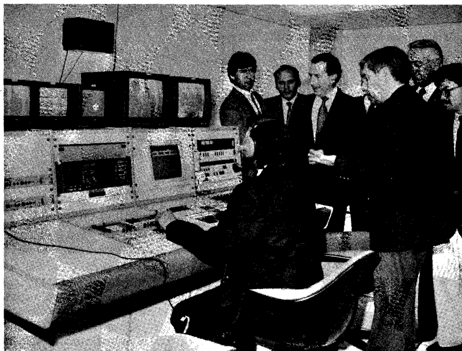
El Presidente del Ecuador, Dr. Rodrigo Borja, gratamente impresionado con las instalaciones del Estudio de TV

Adicionalmente, Visnews tiene un programa anual de entrenamiento para profesionales de diferentes países. En ese marco, CIESPAL podría pedir y proponer estudiantes, periodistas, gerentes, directores, etc. para aprovechar este programa.