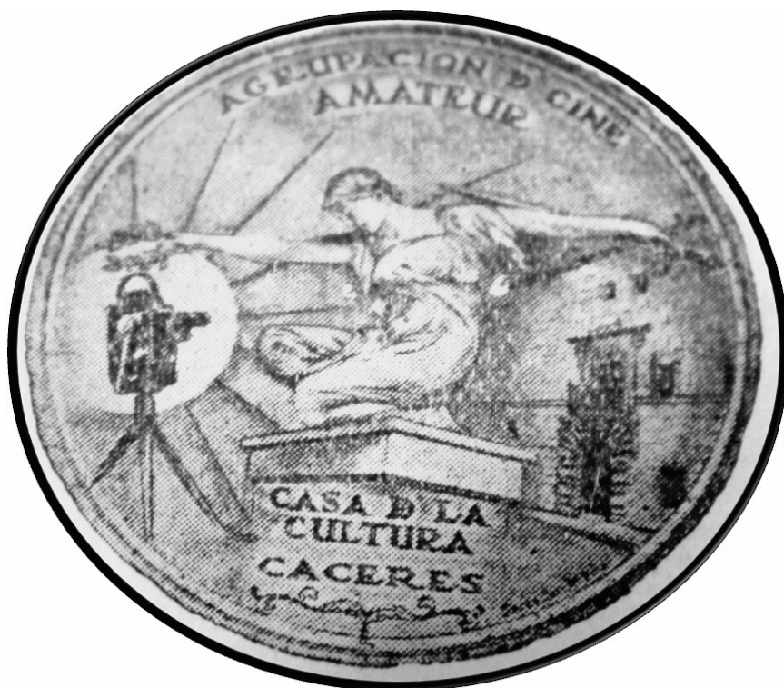
Fig. 9. Emblema de la Agrupación de Cine Amateur de la Casa de la Cultura.

Para concluir las presentes reflexiones no puede obviarse que la devoción que Cáceres siente durante estos años por el Cine termina convirtiendo al Séptimo Arte en toda una deidad, en concreto, la que aparece representada en el emblema que sirve como logotipo de la Agrupación de Cine Amateur de la Casa de la Cultura. Se trata de un emblema de inesperada belleza y gran complejidad, realmente logrado, en el que una figura femenina que recibe el tratamiento de divinidad se dispone sobre una peana de libros procedentes de la Biblioteca Pública, acogida en esos años en el Palacio de la Isla, lugar hacia el que la diosa tiende su brazo izquierdo al tiempo que con el derecho establece un puente entre los libros y la cámara de cine, a la que coloca una corona de laurel, como si de entre toda la cultura el Cine fuera el ganador; al mismo tiempo, el Séptimo Arte devuelve, con el foco de la cámara como metáfora, todo su brillo, todo su esplendor y luminosidad a esa Casa de la Cultura y Biblioteca de la que procede y de la que se alimenta.