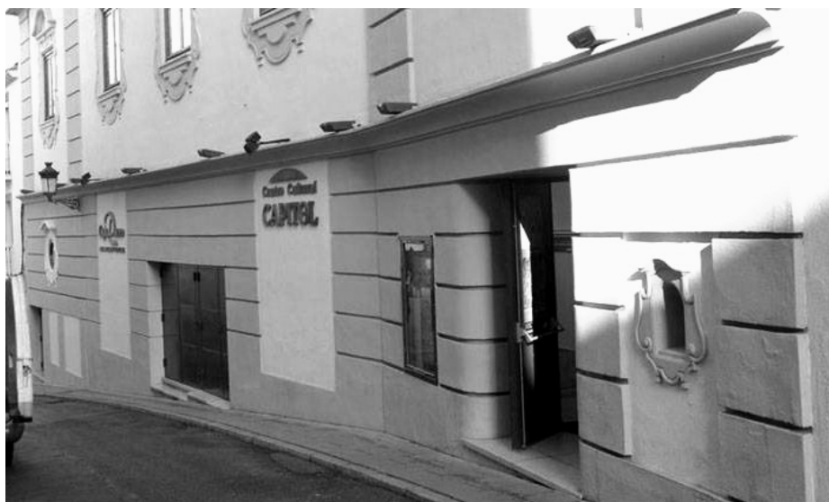
Fig. 3. Cine Capitol, de Luis Martínez-Feduchi

Si bien estos tres edificios seguían funcionando en la época, se habían quedado pequeños para acoger al cada vez mayor número de espectadores, que reclamaban más sitios para volcar su afición. De esta manera, la década de los años sesenta va a conocer la construcción de otros dos cinematógrafos. El primero de ellos, inaugurado en 1962, será el Cine Coliseum, proyectado por el arquitecto cacereño Fernando Hurtado Collar e inserto en un edificio de gran altura, tal y como Ricardo Durán había imaginado que sería Cáceres en el futuro. Al año siguiente, la calle San Pedro de Alcántara asistía a la edificación del Cine Astoria, diseñado por el también arquitecto cacereño Vicente Candela Rodríguez. Al morir Candela de forma prematura, sería también Martínez Feduchi, el autor del Cine Capitol, quien culminara su construcción. De hecho, la fachada viene a ser el resultado de los cambios acometidos por Feduchi y no responde a la idea original de Candela, quien proponía un inmueble con una estética muy próxima al que tiene el Colegio de Santa Cecilia aledaño, también proyecto suyo, pues tenía la idea de crear una manzana de edificios, un conjunto arquitectónico estéticamente uniforme, aunque en un caso se trata de un edificio de ocio y en el otro, de un centro educativo 12 .