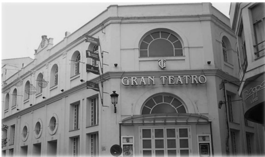
Fig. 1. Edificio del Gran Teatro

El primero de ellos, construido en los felices veinte, es el Gran Teatro, que desde su inauguración compaginó el escenario para obras dramáticas con la gran pantalla para proyecciones cinematográficas. Incluso, y dado que su construcción fue tan sumamente costosa y lenta en el tiempo, hubo una época – en la que todavía carecía de cubierta– en la que vino a funcionar como barraca de cine, conocida como el Cine de San Juan 10 .