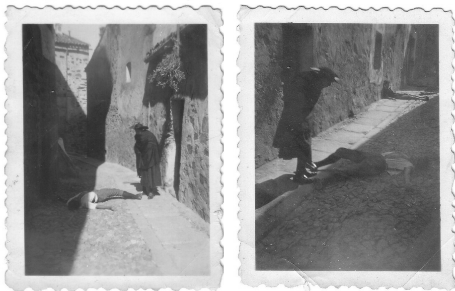
Figs. 7 y 8. Fotografías de rodaje de Éxodo de salvación

Pero, ¿por qué esta película resulta de tanta importancia para Cáceres? La respuesta reside en el hecho de que Éxodo de Salvación se presenta como una especie de réplica, de “venganza”, o, mejor dicho, como una vuelta de tuerca a una película que se había estrenado veinte años antes. Nos referimos a El agua en el suelo , del año 1934 y dirigida por Eusebio Fernández Ardavín, que en su día fue publicitada y promocionada como la primera película sobre Cáceres, y que constituyó una enorme decepción debido a que no se mostraba ésta como tal con sus calles ni con sus gentes, sino que la ciudad aparecía como si de una Vetusta de Clarín se tratara, la cual se limitaba a acoger la calumnia que relacionaba a un sacerdote con una feligresa, con el consiguiente enojo del clero local, que, dos décadas más tarde, con una película que giraba en torno a la fundación del santuario de la patrona, se veía totalmente resarcido y recompensado por aquella afrenta.