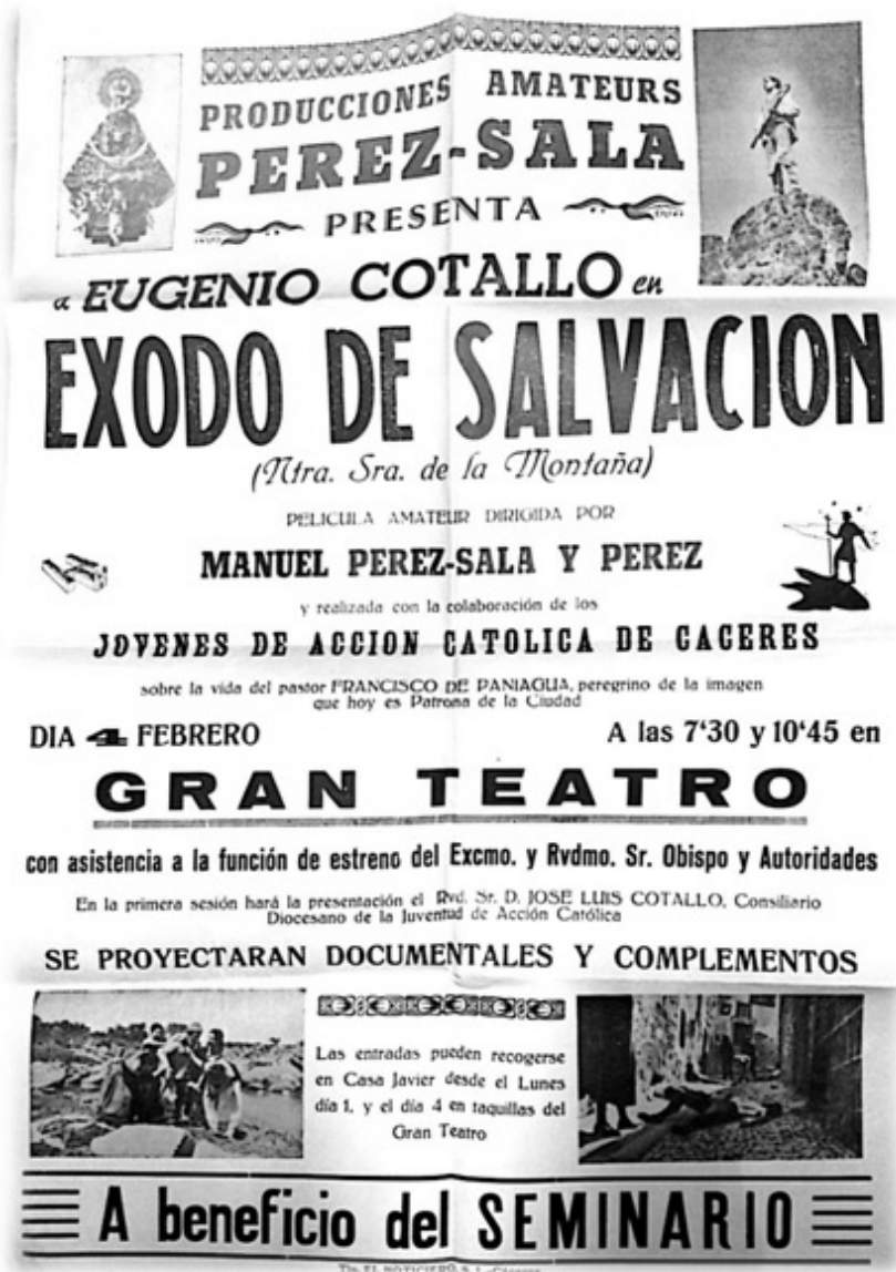
Fig. 6. Cartel inédito de la película Éxodo de salvación (Archivo particular de la autora por gentileza de Luis Montalbán, que intervino como actor en el filme).