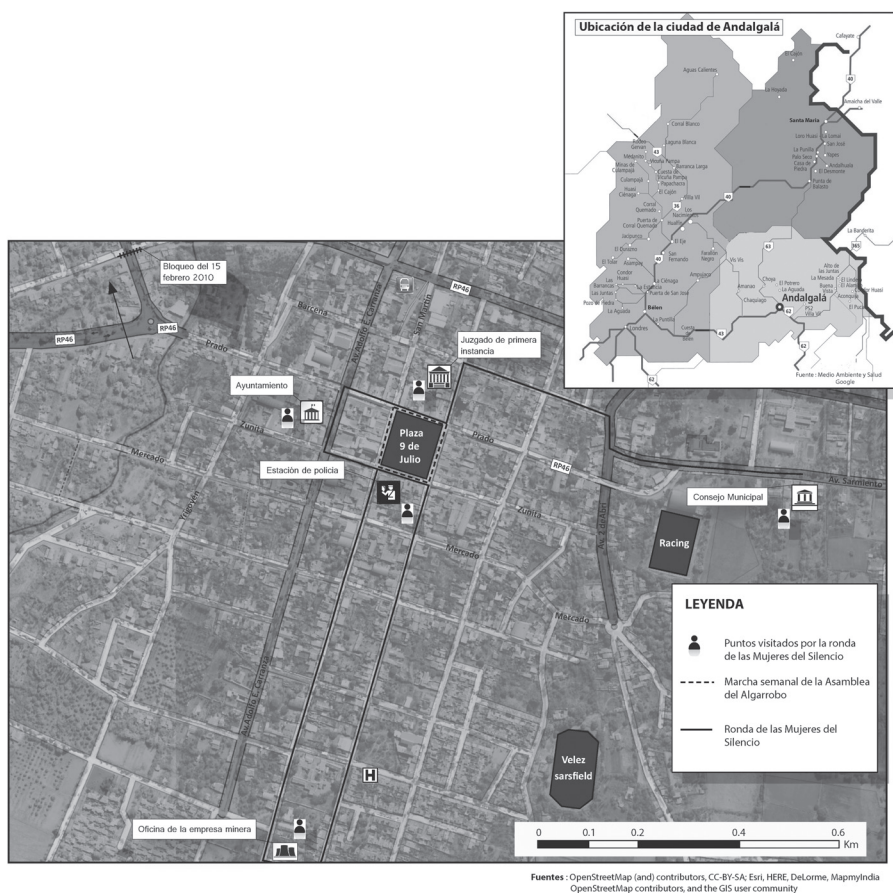
Figura N° 2 Acciones de la Asamblea del Algarrobo y de las Mujeres del Silencio en Andalgalá

que participan en la Asamblea del Algarrobo y en el grupo las “Mujeres del Silencio” consideran que la lucha contra los megaproyectos mineros es coherente con su rol social. Según las entrevistadas, éste consiste en proteger el bien común. Por ello es que se sienten responsables de oponerse a un modelo extractivo, que consideran perjudicial para su territorio. La lucha que libran las mujeres en Andalgalá contra los impactos de los megaproyectos mineros asociados al capital transnacional sobre el medioambiente y la calidad de vida de la población en el ámbito local da testimonio de la aspiración de la mujer por obtener el reconocimiento merecido por su participación en los movimientos sociales (Cánovas, 2008).