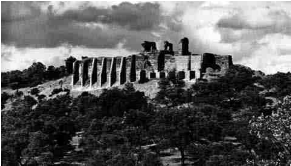
Vista de la ciutat romana de Mulva – Manigua. Villanuerva del Río i Minal (Sevilla, segona meitat del segle I d. C.).