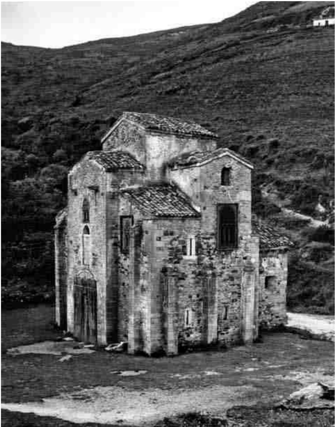
Església prerromànica asturiana de Sant Miquel de Lillo (Ovieda). Fou consagrada l'any 848.