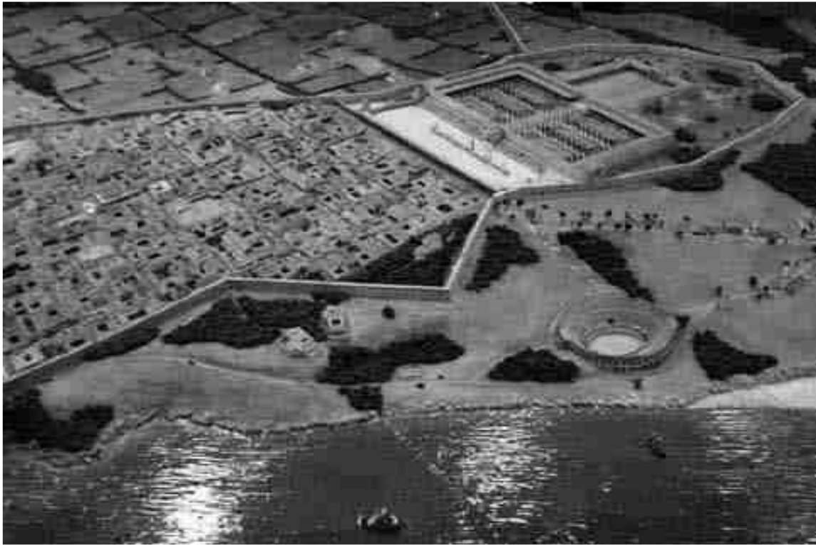
Construccions romanes a la terrassa superior de l'antiga Tàrraco.

desenvolupament urbà i, sobretot, en el sentit de ciutat imperial, de presència de l'Imperi a Hispània, amb un centre on la voluntat de Roma imposava des de les estructures materials d'una ciutat, la constant presència de la seva realitat política i econòmica.