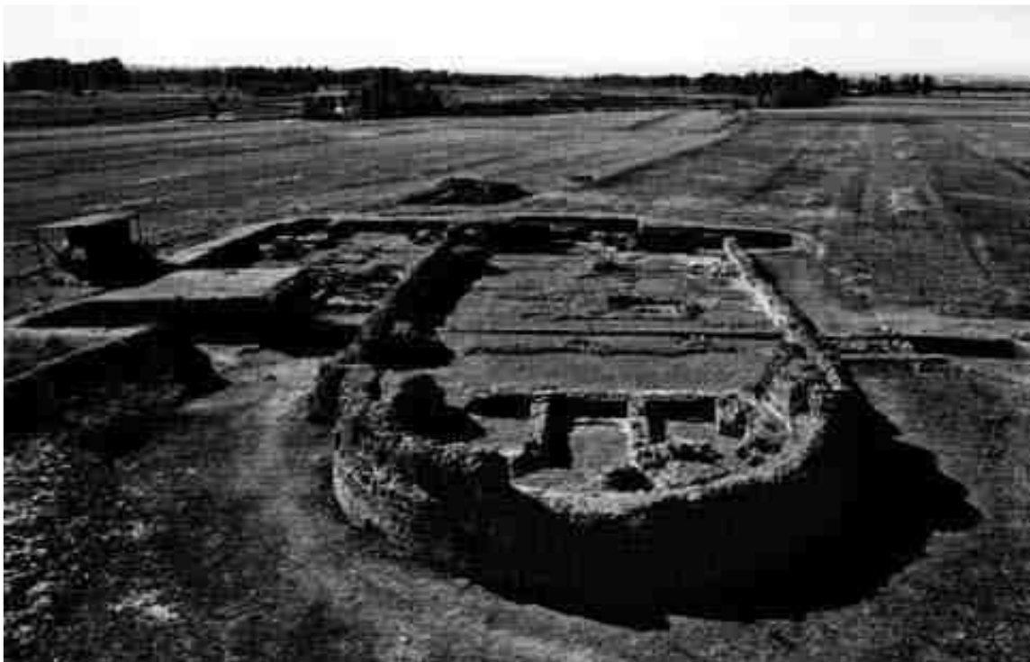
Església martirial de Marialba (Lleó), Inicis del segle V d. C.