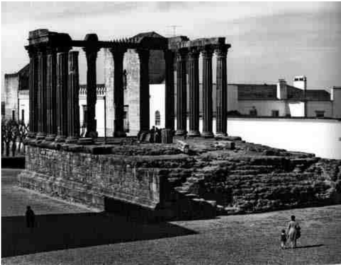
Temple romà d'Èvora (Portugal), primera meitat del segle I d.C.