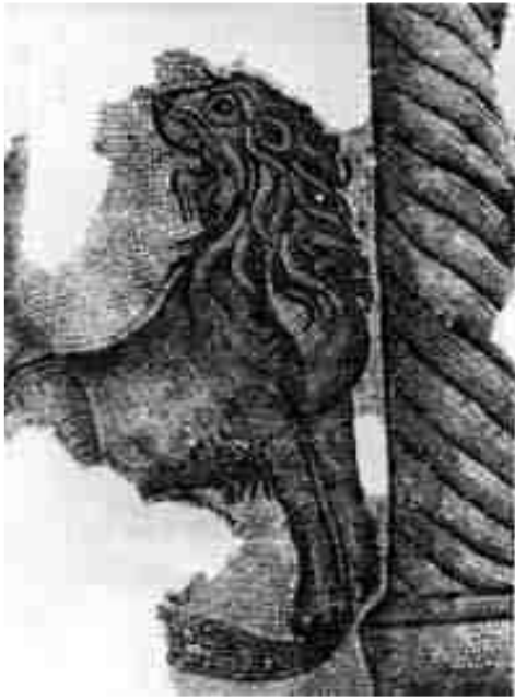
Detall de l'escena de Daniel amb els lleons, que decora el fris intermedi de la cúpula de la vil·la romana de Centcelles