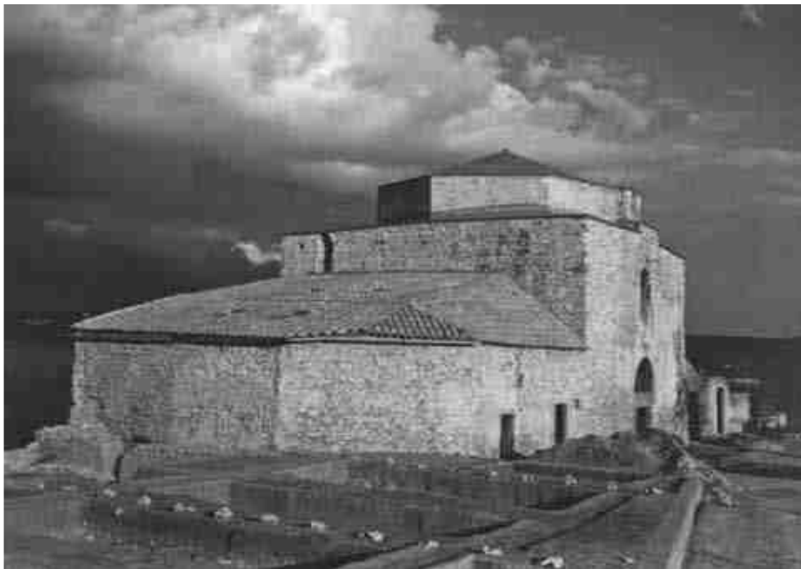
Vista dels edificis conservats a la vil·la romana de Centcelles (s. IV).