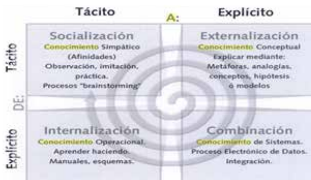
Figura 1. Procesos de Conversión del Conocimiento en la Organización.

Por lo tanto en la interacción que realizan los cuatro tipos del conocimiento, se puede distinguir la socialización (tácito a tácito), combinación (explícito a explícito), exteriorización (tácito a explícito), interiorización (explícito a tácito), las cuales mencionan la relación que hay cuando se adquiere el conocimiento y este interactúa con la capacidad de intelectual de cada ser humano. Nonaka enmarca sus distintas manifestaciones bajo el nombre de filosofías interpretativas tales como fenomenologías y pragmatismo. Afirmando que el conocimiento y las entidades sociales no pueden entenderse como realidades objetivas, dado el ejemplo los filósofos fenomenológicos proponen que el conocimiento humano es subjetivo, situacional, corpóreo, relativo e interpretativo