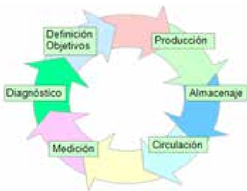
Figura 2. Ciclo de la gestión del conocimiento.

Es necesario determinar el estado en que se encuentra la gestión del conocimiento al interior de la organización, con lo cual se van a definir las necesidades de conocimiento y de su gestión (tecnología, en procesos, personas y valores). Sin embargo, pueden definirse las principales funciones según lo muestra a la Figura 2 que en forma de ciclo encaja las funciones de producción, almacenaje, circulación, medición, diagnóstico, en cumplimiento de uso objetivos previstos.