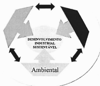
Quadro 1 - Objectivos do Sistema de Licenciamento Industrial

DESENVOLVIMENTO INDUSTRIAL SUSTENTÁVEL EXIGE DESENVOLVIMENTO EQUILIBRADO DAS SUAS 3 DIMENSÕES: