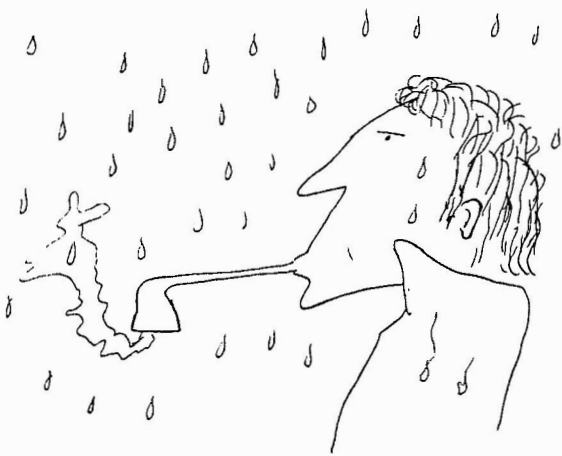
Fig. 1 - Um hidrólogo experiente.

A Hidrologia é a ciência que trata do estudo das reservas, distribuição e propriedades da água na Natureza. A sua importância é facilmente compreensível quando se considera o papel da água na vida humana. A crescente necessidade do homem em utilizar, controlar e preservar os recursos hídricos de que dispõe tornou a hidrologia uma ciência básica cujo conhecimento e aplicação são necessários e imprescindíveis ao engenheiro civil e a muitos outros profissionais, conforme foi compilado por MANIAK (1993), e.g. engenheiro agrónomo, florestal, de ambiente (Fig. 1).