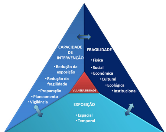
Fig. 4 - O modelo conceptual da vulnerabilidade aos incêndios florestais.

O modelo conceptual que este artigo propõe (fig.4), constituído por três componentes, resulta da experiência de validação do esquema teórico do projeto MOVE no âmbito dos incêndios florestais. A principal diferença entre ambos é a designação da terceira componente, embora também existam algumas diferenciações nas definições propostas para cada uma das componentes.