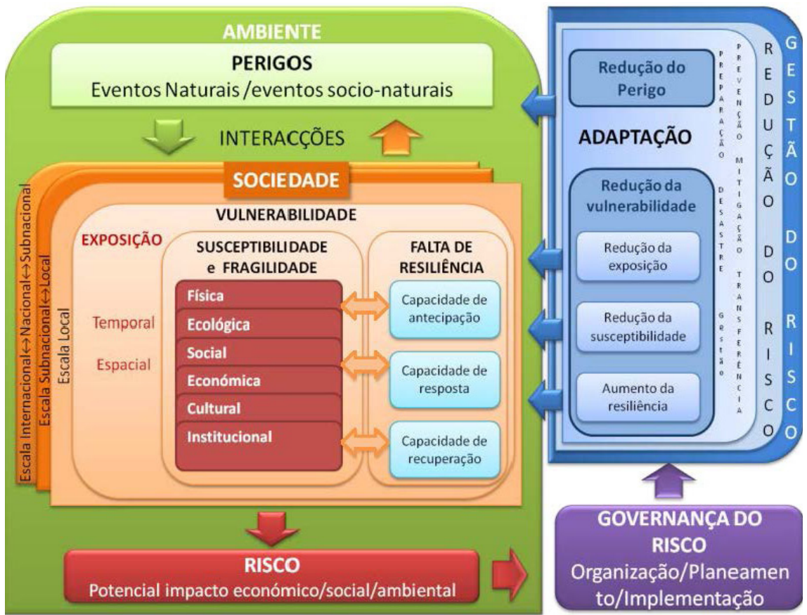
Fig. 3 - A vulnerabilidade aos riscos naturais segundo o esquema conceitual do projeto MOVE (Methods for the improvement of vulnerability Assessment in Europe).