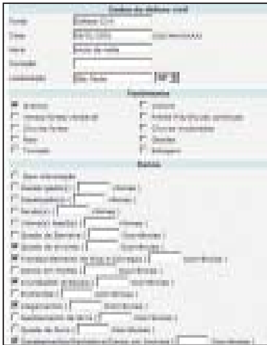
Fig. 5 - Parte da tela de alteração/inserção dos dados

(interpretador php); Debian 4 (sistema operacional do servidor); MySQL 5.0 (banco de dados).