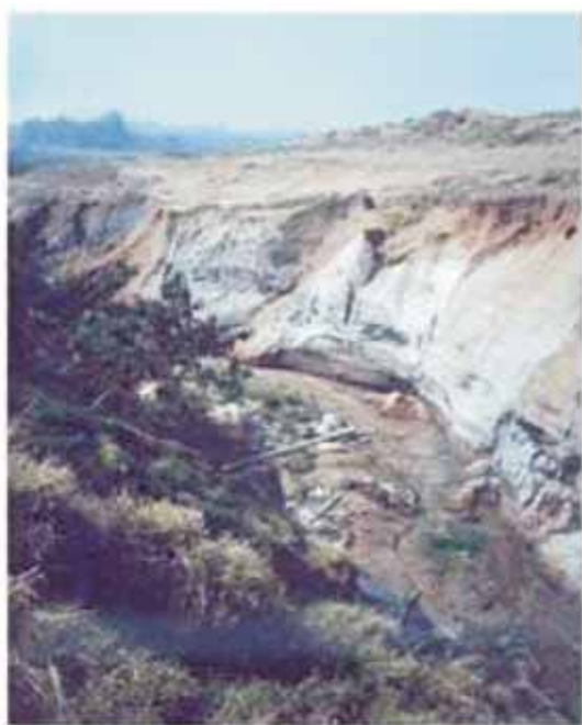
Fot. 1 -Vista parcial da voçoroca do Córrego Tucum.

Nas cabeceiras do Córrego Tucum situa-se uma voçoroca (fot. 1) que já foi considerada uma das maiores do Estado de São Paulo, chegando a apresentar 60 m de profundidade e 2 km de extensão.