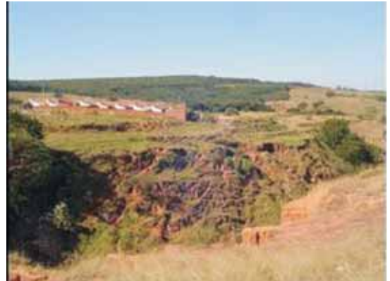
Fot. 6 - Loteamento para população de baixa renda, construído em área de risco (terraços arenosos de pouca coesão).

Tais obras civis foram autorizadas e construídas sobre os terraços implantados no interior da voçoroca. O material constituinte de tais terraços, como citado anteriormente, possui grande fragilidade, haja vista sua pouca coesão, pois consiste de material arenoso, transportado e constantemente revolvido por máquinas desde o início dos anos 90 (fot. 6). Além disso, verificou-se a presença de abatimentos (subsidência do terreno) em grande parte de tais terraços, a exemplo da própria área do referido loteamento.