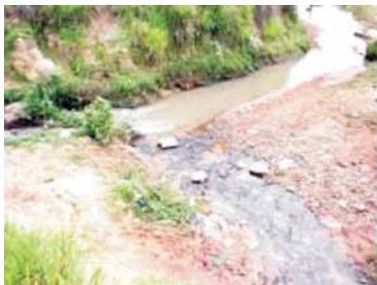
Fot. 3 - Lançamento de Esgoto in natura no Córrego Tucunzinho.

Além disso, foi efetuado neste mesmo período o desvio do esgoto, que antes era lançado na voçoroca, em conjunto com início de obras para a criação de uma rede de tratamento para o mesmo (fot. 3).