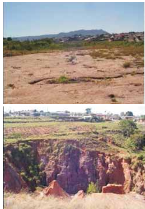
Fot. 7 - Formação de sulcos erosivos e ravinas nas proximidades da voçoroca.

Dado o histórico de destruição dos terraços implantados inadequadamente nos últimos 18 anos, e o constante surgimento de sulcos erosivos, que podem evoluir rapidamente para novas ravinas (fot. 7) é possível afirmar que todas essas obras civis podem futuramente ficarem comprometidas pela dinâmica dos processos geomorfológicos existentes.