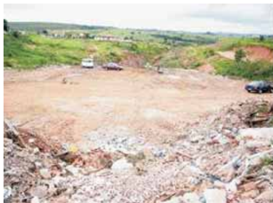
Fot. 4: Área clandestina de deposição de lixo.

Recentemente surgiu outro ponto (fot. 4) de destinação de resíduos na cidade. Trata-se de um local localizado no bairro São Dimas, próximo à área do antigo “lixão” (fig. 2), que recebe descarte clandestino de resíduos domésticos, carcaças de animais, materiais inertes e restos de podas de árvores .