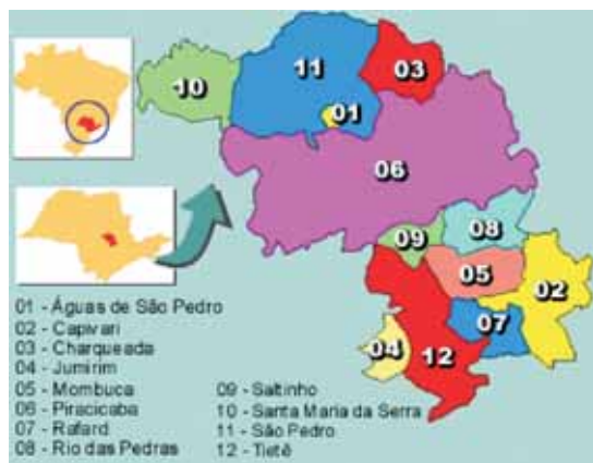
Fig. 1- Localização da Estância Turística de São Pedro (s/esc.).

O município de São Pedro está situado na região sudeste do Brasil, no setor centro-leste do Estado de São Paulo (fig. 1) entre as coordenadas aproximadas de 22° 41' e 22° 26' de latitude sul e 48° 05' e 47° 47' de longitude oeste.