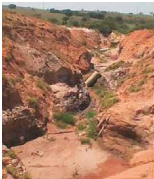
Fot. 2 - Vista parcial da voçoroca com tubulações destruídas.

500 metros de extensão, em cada ramificação da voçoroca. Tais medidas foram necessárias, haja vista que as tubulações instaladas anteriormente foram destruídas pela dinâmica erosiva (fot. 2).