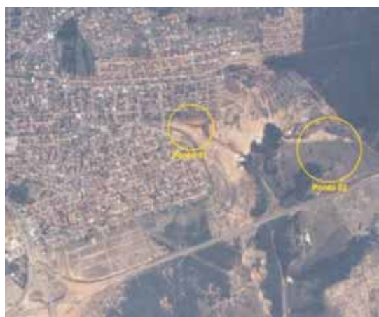
Fig. 2 - Área clandestina de destinação de resíduos, sendo ponto 01: área clandestina atual; ponto 02: área do antigo Lixão Municipal, desativada em 2003.

A área é particular e, por estar localizada na cabeceira de uma das ramificações da voçoroca, apresenta assim grande fragilidade. Constantemente o proprietário e a Prefeitura fazem a manutenção do terraceamento do terreno. Apesar da deposição clandestina de lixo, os moradores transitam pela área, através de “atalhos”, que são usados por pedestres e pessoas com veículos, para terem acesso a bairros vizinhos. O trânsito intenso na área poderia provocar a desestabilização dos taludes, podendo formar caminhos preferenciais para aumentar a energia das águas da chuva e agravar o já grave processo erosivo da área.