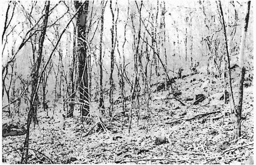
Figura 7 - Fisionomia da Vegetação de Caatinga Arbórea sob solo sedi- mentar (Sussuapara, PI).

mesmas áreas fossem incluídas em unidades de conservação de uso direto (áreas de uso sustentável), como o déficit é de 7,3%, áreas de 384.446,47 a 683.280,0ha; de 381.614,8 a 609.550,0ha e de 119.333,1 a 936.098,71ha poderiam ser acrescentadas em termos de Caatinga, Cerrado e Ecótonos, respectivamente.