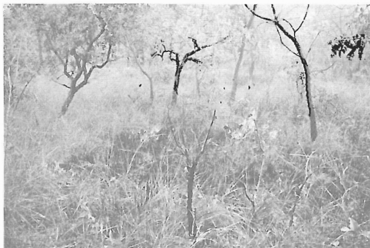
Figura 3 - Fogo no Cerrado (Estação Ecológica de Uruçuí-Una) (Baixa Grande do Ribeiro, PI).

Nos meses de agosto a novembro o número de focos de calor varia abruptamente de 2.000 para mais de 16.000 focos. No período de 1998 a 2002, os anos de 2001-2002 se destacam negativamente para o Nordeste do Brasil. Como grande parte dos fogos autorizados se alastram, assumindo com frequência o “status” de incêndios (fogos descontrolados), até algumas unidades de conservação de uso indireto são fortemente impactadas no Sudoeste do estado do Piauí. A Figura 3 mostra um flagrante disto na Estação Ecológica de Uruçuí-Una.