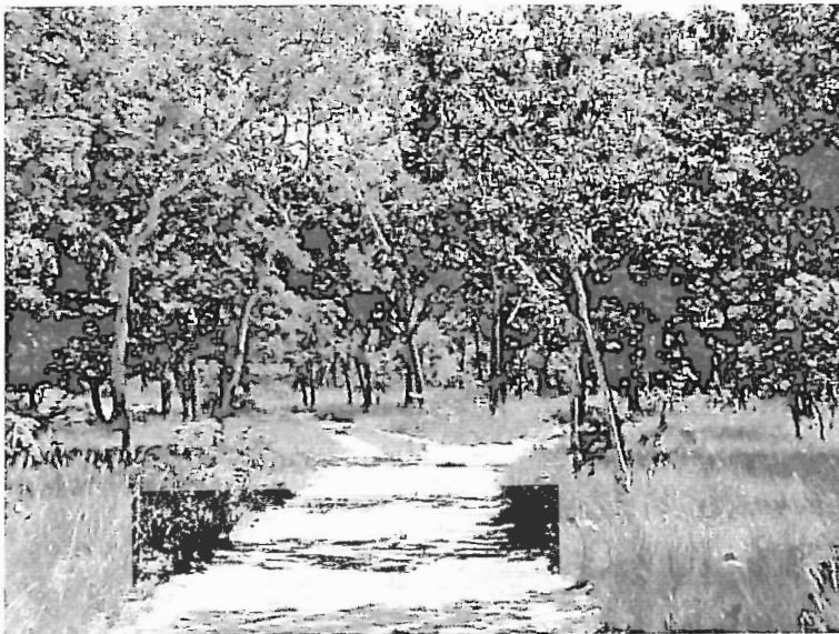
Figura 8 - Fisionomia da Vegetação de Cerrado (Cerradão de Cerrado) (Chapadinha, MA).

selecionar a maior e, a partir de dados científicos, redimensionar a menor, do que se fazer o contrário. Se podemos, hoje, remapear o território brasileiro através dos instrumentos poderosos dos “pactos” sociais e políticos autóctones, estimulados pelo espírito do “zoneamento ecológico-econômico”, por exemplo, por que não fazê-lo? Do contrário, não vamos sair da inalterabilidade de que o remapeamento é uma prerrogativa das (também nossas) políticas alóctones. Para isto, cada vez mais precisamos aprender a substituir as “parcerias da miséria” pelas “parcerias da abundância”.