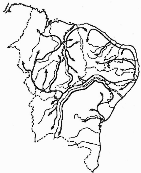
Figura 1 - Prováveis Rotas das Frentes de Gado – período de 1500 a 1700 (Séculos XVI e XVII) (COIMBRA FILHO & CÂMARA, 1996).

No Nordeste brasileiro, a conversão de vegetação nativa para atividades agropecuárias remonta aos Séculos XVI e XVII. Segundo COIMBRA FILHO & CÂMARA (1996), os primeiros desmatamentos estão associados com as “prováveis rotas das frentes de gado no período de 1500-1700” (Figura 1). Segundo o MEC (1959; citado também por COIMBRA FILHO & CÂMARA, 1996), as atividades econômicas do Século XVIII relacionam diretamente aquela conversão por culturas de cana-de-açúcar no litoral atlântico nordestino e na baixada maranhense, bem como a pecuária ao longo das margens do rio São Francisco, principalmente no estado da Bahia, e nas margens do médio e baixo Parnaíba, nos estados do Piauí e do Maranhão. A mineração, mais localizada no centro da Bahia àquela época, também pode estar associada com estes grandes e paulatinos desmatamentos ao longo da história de ocupação do Nordeste do Brasil.