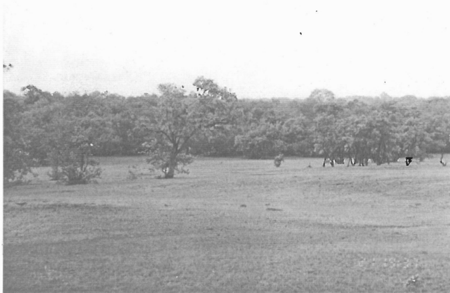
Figura 10 - Vegetação de Transição Cerrado/Caatinga/Carrasco no Complexo de Campo Maior (Fazenda Lourdes, Campo Maior, PI).

Como o conceito de vulnerabilidade é ainda antropológico e a espécie humana não é a única componente