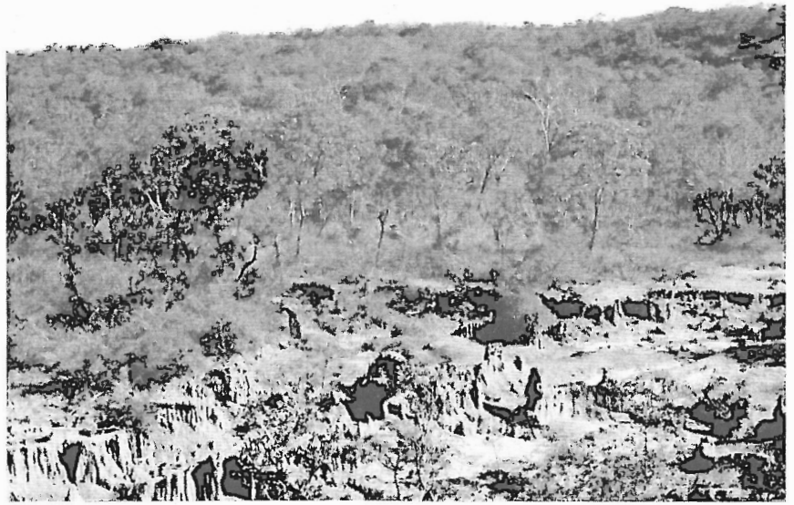
Figura 5 - Trecho de Vegetação de Cerrado na Estação Ecológica de Uruçuí-Una (Baixa Grande do Ribeiro, PI) localizada ao Norte do município de Gilbués (PI): Geologia/Solos versus Degradação Ambiental.

(1998, 2002), para Gilbués (PI), por exemplo, os dados secundários que existem, porque incompletos, não sistemáticos e generalistas, são muito inclusivos (muito regionais).