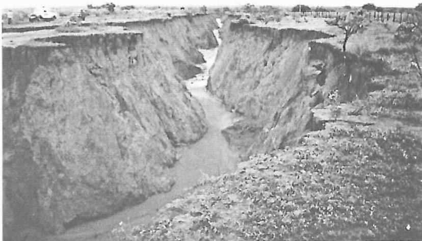
Figura 6 - Voçoroca gigante em área cultivada de Cerrado (Santa Filomena, PI) localizada a Oeste do Município de Gilbués (PI): Desmatamento versus Degradação Ambiental.

De acordo com dados adaptados do IBGE (1975, 1985, 1991, 1993), 76.505.909ha (20,9%) do Semi-Árido se encontram desertificados e 10,6%