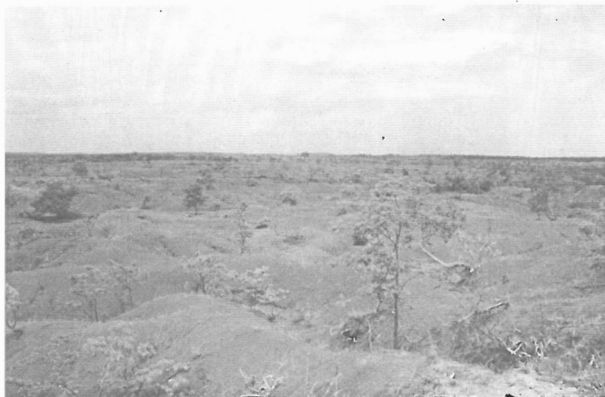
Figura 4 - Área de Cerrado em processo acentuado de Degradação Ambiental (Gilbués, PI).

Com relação às escalas de trabalho, se macro-regional, regional ou local, o que se tem conhecimento é de que há pouco ou nenhum investimento para estudos de campo, de experimentação, forçando com que as abordagens considerem quase sempre o fenômeno apenas ao nível de pequenas escalas. Como quase não há dados primários, fazendo exceção MORTIMORE (1994), RODRIGUES (1998) e SALES