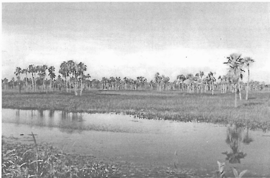
Figura 9 - Fisionomia da Vegetação do Complexo de Campo Maior (Savana de Copernicia). (Campo Maior, PI).