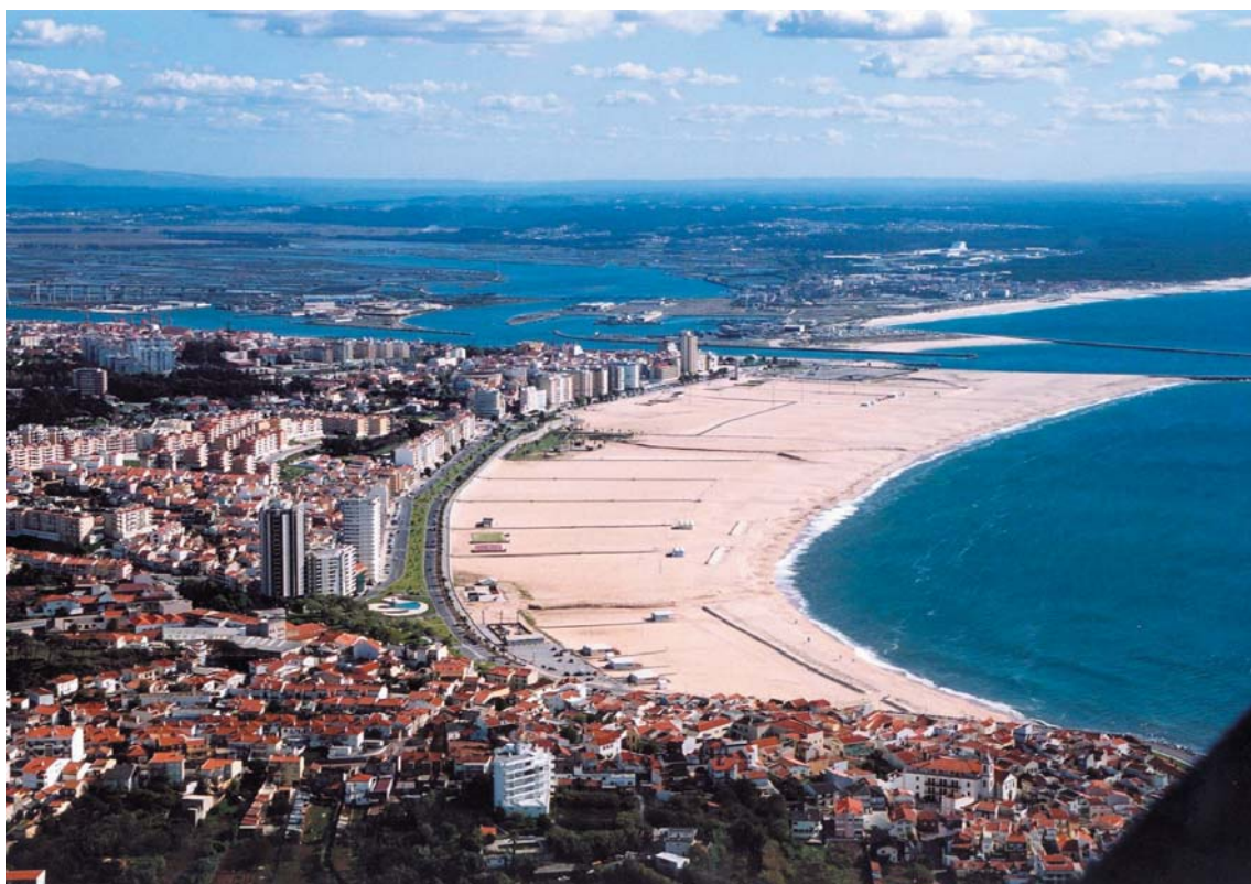
Foto 5 - Figueira da Foz - foz do Mondego (23 de Outubro de 2003) . Fotografia de Jorge Dias