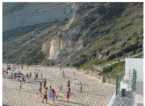
Foto 8 - Praia da Nazaré - base da arriba do Sítio (Agosto, 2006).

Tanto no litoral ocidental, como no litoral meridional, existem arribas em risco de desabamento. Pode falar-se, mesmo, em perigo, tal é, às vezes, a proximidade previsível de uma ocorrência daquele tipo. E isso deve ser dado a conhecer aos utentes das pequenas faixas de areia que se encontram na sua base, tal como aos habitantes que residem no seu topo. Em alguns locais é já vulgar encontrarem-se tabuletas informando sobre o risco ou, mesmo, sobre o perigo de derrocada. Noutros locais, de que pode dar-se como exemplo o caso da Praia da Nazaré, foi, mesmo, interdita a ocupação da areia na base da arriba (Fot. 8, 9 e 10).