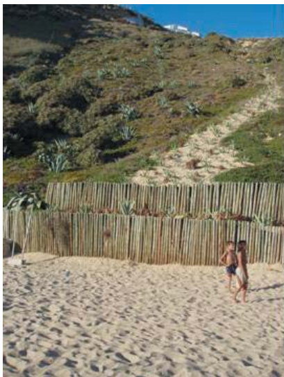
Foto 9 - Praia da Nazaré (Agosto, 2006) . Romagem da Rót.8 (lado direito) - paliçada de madeira com a finalidade de evitar a passagem das pessoas e de ajudar à fixação das areias de um antigo caminho.