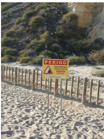
Foto 10 - Praia da Nazaré (Agosto, 2006) . Aviso de perigo de queda de blocos e paliçada de proteção sobre a areia, na base da arriba.

De grande beleza são as arribas das ilhas dos Açores ou da Madeira. No caso dos Açores, ganham em importância as arribas da Ilha de São Jorge. Com alturas de, por vezes, mais de 600 metros, em locais de elevado risco sísmico, os desabamentos foram espectaculares ao longo da história e provocaram o aparecimento de acumulações de detritos (fajãs) a que, em alguns casos se vieram a juntar materiais depositados pelo mar criando, por vezes, pequenas lagunas (A. G. B. RAPOSO, 2004) . De vez em quando, nem são necessários sismos para que se registem desabamentos enormes, deslizamentos ou extensos fluxos de detritos. A instabilidade é grande e na sequência de um período de chuvas mais abundantes pode ocorrer uma derroca-