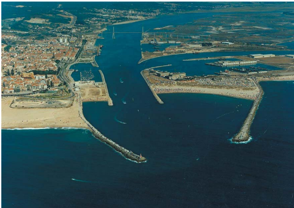
Foto 4 - Figueira da Foz - foz do Mondego (27 de Agosto de 1995, às 16 horas) . Fotografia de Jorge Dias