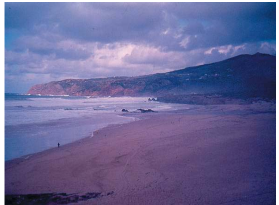
Foto 1 - Praia do Guincho e Serra de Sintra (Fevereiro de 1977)

afirmando que "parte dos sedimentos das praias portuguesas vem do tsunami ligado ao sismo de 1755" (H. REGNAULD, et al., 2004). Não será, de certeza, uma afirmação válida para todas as praias de Portugal, mas sê-lo-á muito provavelmente para as praias da região de Lisboa bem como para as praias que lhes ficam a Sul. Pelo menos, dois casos parecem apontar para uma ligação desse tipo. Com localização entre a área da foz do Tejo e a Serra de Sintra, a praia do Guincho (Fot. 1) tem uma dimensão que poderá relacionar-se com aquele efeito do tsunami. Mais para Sul, no Algarve, a dimensão da Meia Praia (Fot. 2), em Lagos, poderá relacionar-se, igualmente, com as consequências do mesmo tsunami. Muitas outras praias foram afectadas, mas não parece razoável que o processo referido tenha sido importante na maior parte das que se encontram no Centro e no Norte do país. O tsunami que atingiu Lisboa em 1755 consta, também, da lista dos "tsunamis notáveis", em quinto lugar, com 10000 mortos estimados em Portugal, Espanha e Norte de África (E. ZEBROWSKI, 1997, Appendix A).