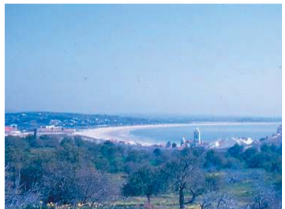
Foto 2 - Meia Praia, vista a partir de Lagos (Agosto de 1971)