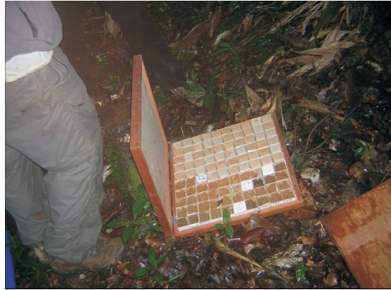
Fig. 4 - Pedocomparador com amostras coletadas a cada 10cm.

de reconhecimento das discontinuidades do manto intempérico para posterior confecção de trincheira.