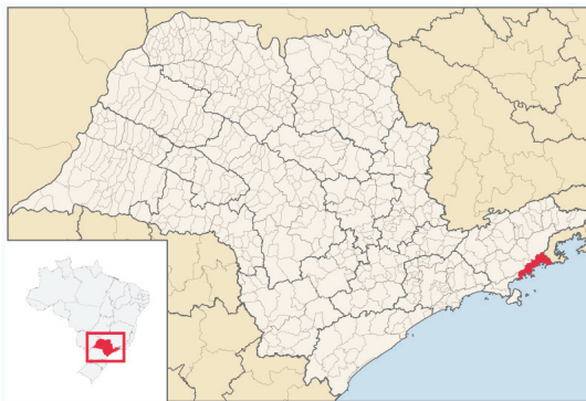
Fig. 1- Localização do Município de Ubatuba (destacado em vermelho).

O município de Ubatuba se encontra nesta região de grande propensão aos fenômenos de escorregamento e que se caracteriza por suas atrações turísticas, tendo um elevado número de visitantes principalmente nas épocas de maiores precipitações que são os meses de férias escolares (dezembro, janeiro e fevereiro). O município está localizado no litoral norte do estado de São Paulo (Fig.1).