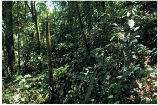
Fig. 3 - Mata Atlântica na vertente selecionada para o estudo.

Após a escolha da vertente foi realizada a coleta e descrição do material através do uso do trado, onde foram descritas a cor, textura, plasticidade e pegajosidade do material. As amostras foram coletadas a cada 10 cm e acondicionadas em um pedocomparador (Fig. 4) para comparações entre os materiais descritos. Nesta primeira parte foram feitos sete pontos de sondagem ao longo da vertente, da base ao topo, utilizando o trado manual do tipo holandês. Essa parte do trabalho de campo é