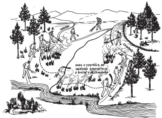
Fig. 3 - Ataque indireto a incêndio florestal.

Em relação ao quarto e último subcapítulo, que diz respeito à extinção, e se estende pelas páginas 22 a 29, começa por afirmar que a extinção corresponde a uma Operação delicada, não isenta de perigos, que requer também muita atenção aos mais pequenos focos.