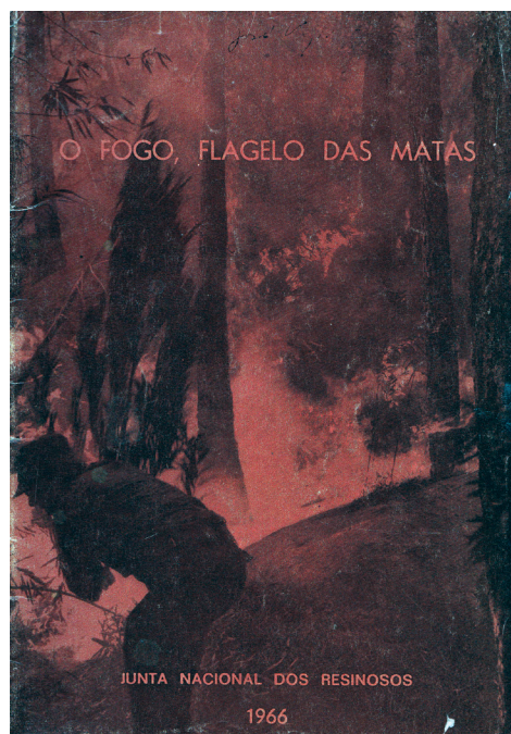
Fig. 1 - Capa do “folheto”: O fogo, flagelo das Matas.

O folheto, como lhe chamaram os autores, começa com uma espécie de introdução que não resistimos a transcrever: