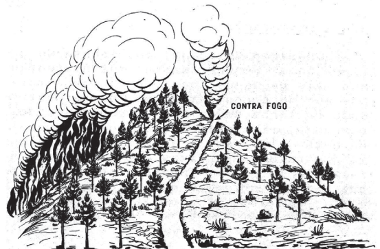
Fig. 4 - Ilustração do uso da técnica do contra-fogo.

Fig. 3 - Indirect attack to forest fire.