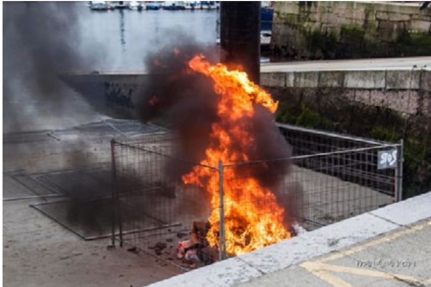
Figura 4. Combustión del "patrón".