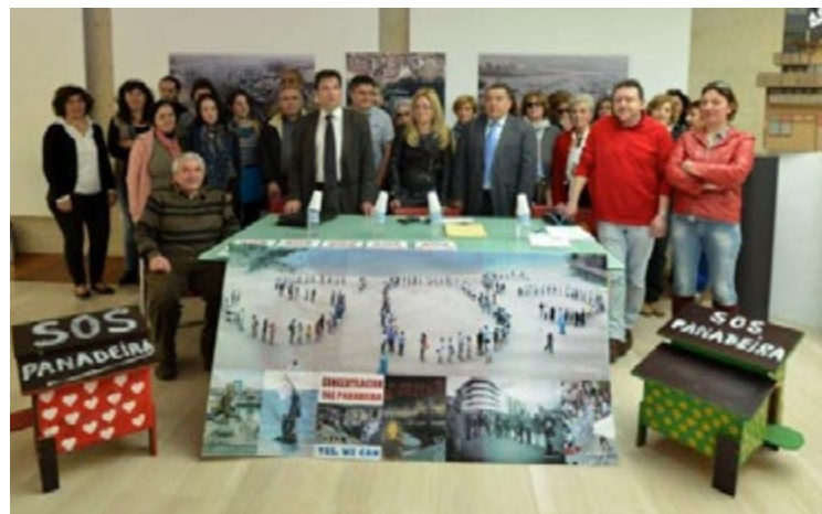
Figura 3. Rueda de prensa