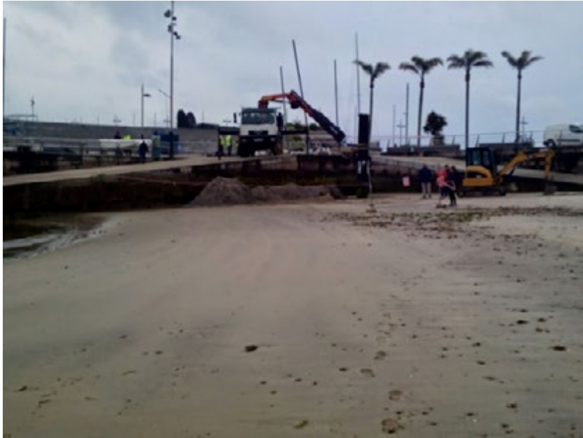
Figura 3. Restaurando la playa.