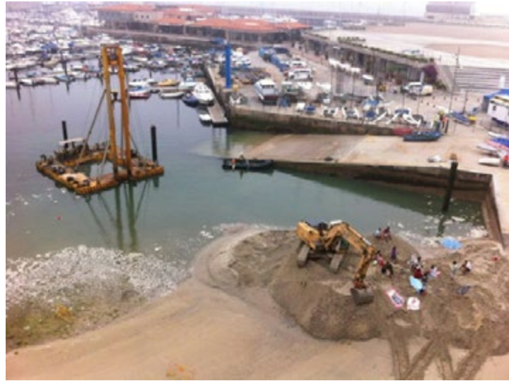
Figura 1. Día uno de activismo directo en el campo.