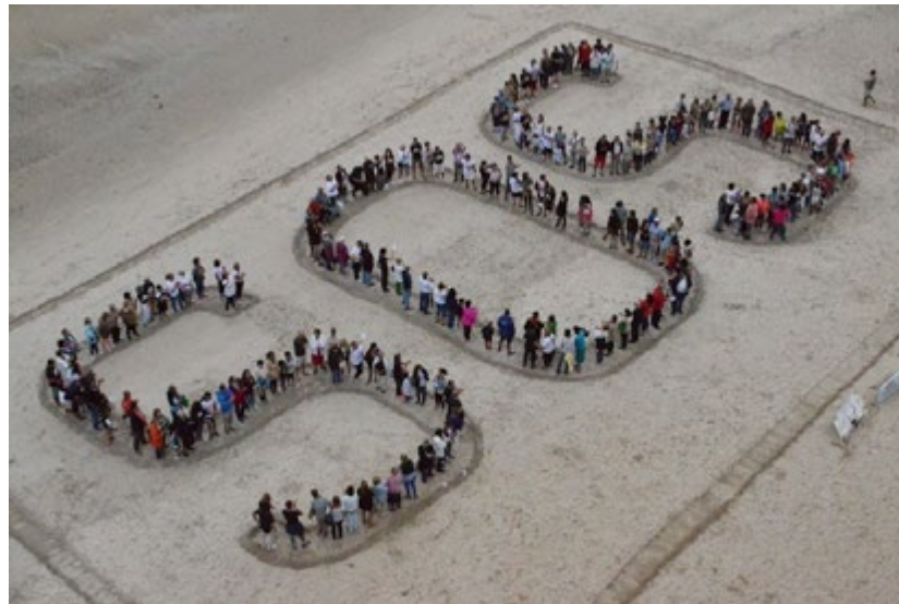
Figura 2. Convocatoria de concentración de SOS PANADEIRA contra la privatización de las playas Panadeira e Iriña.