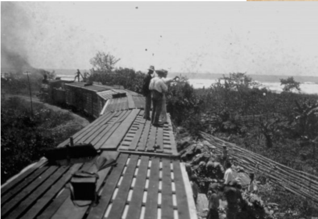
Transportando bananos, Northern Railway Company, 1890.