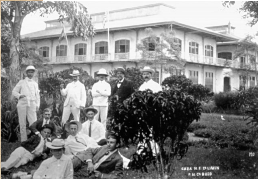
Casa Northern Railway Company, Limón 1890.