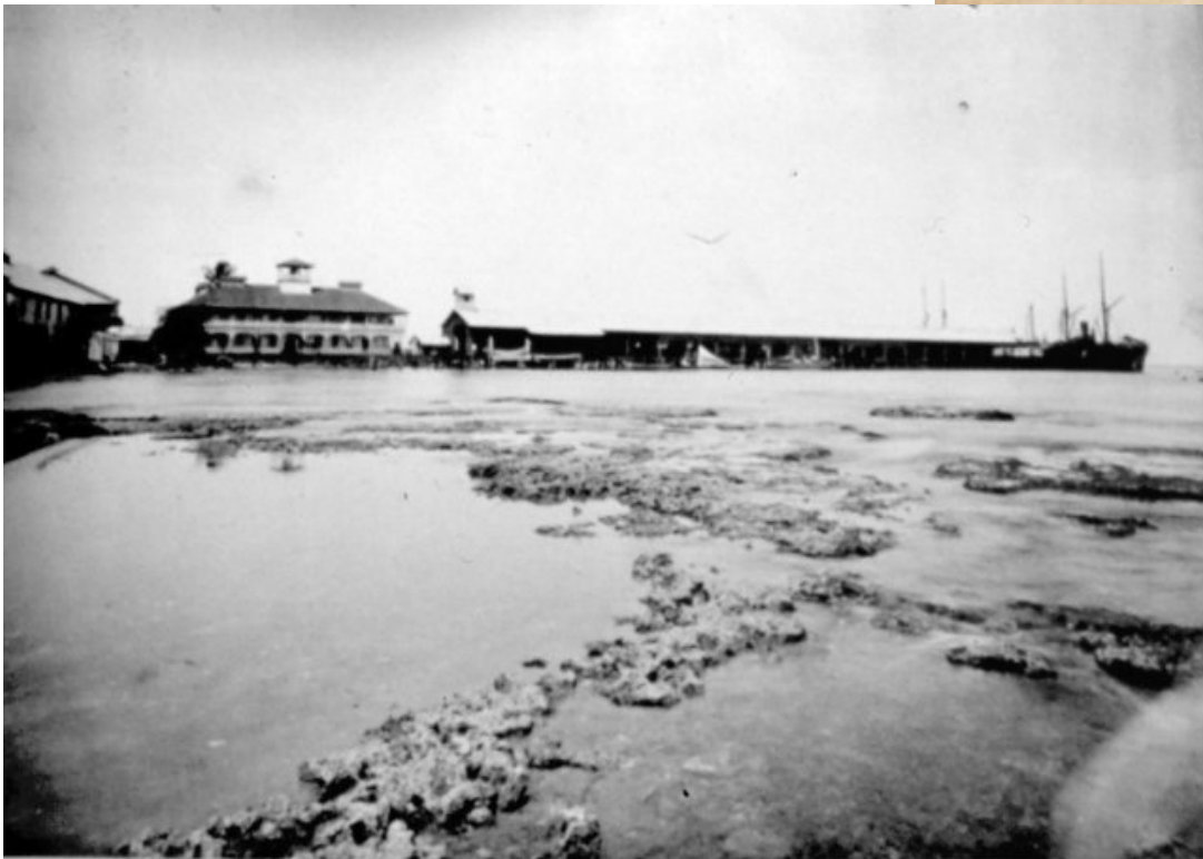
Detalle Puerto Limón, 1890.