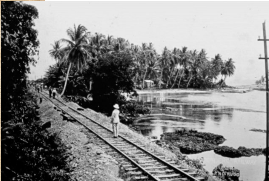
Línea del Ferrocarril Northern Railway Company, 1890.