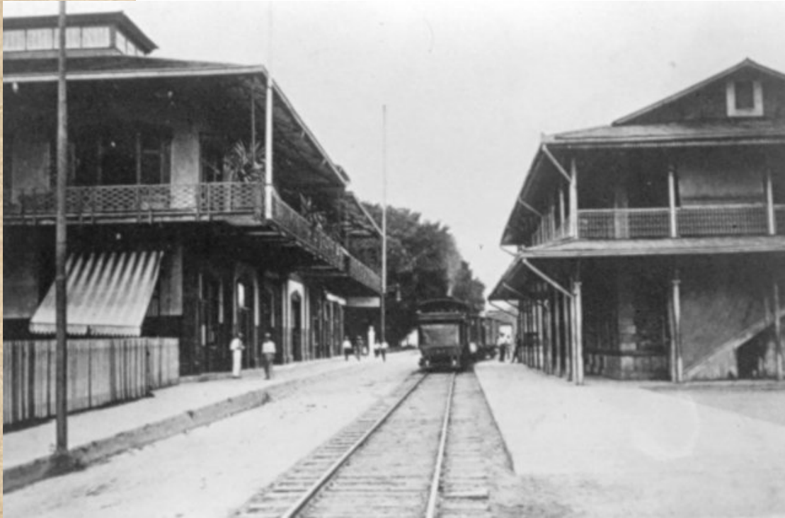
Estación del ferrocarril de Limón, 1922. Álbum Costa Rica, América Central. Manuel Gómez Miralles, Colección CIHAC.