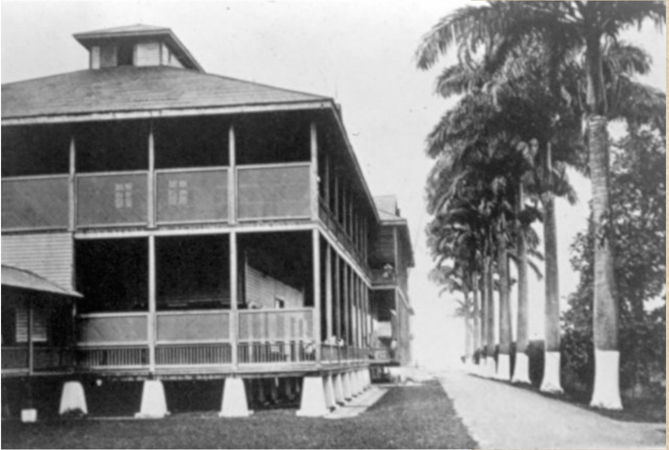
Hospital de Limón, 1922. Álbum Costa Rica, América Central.