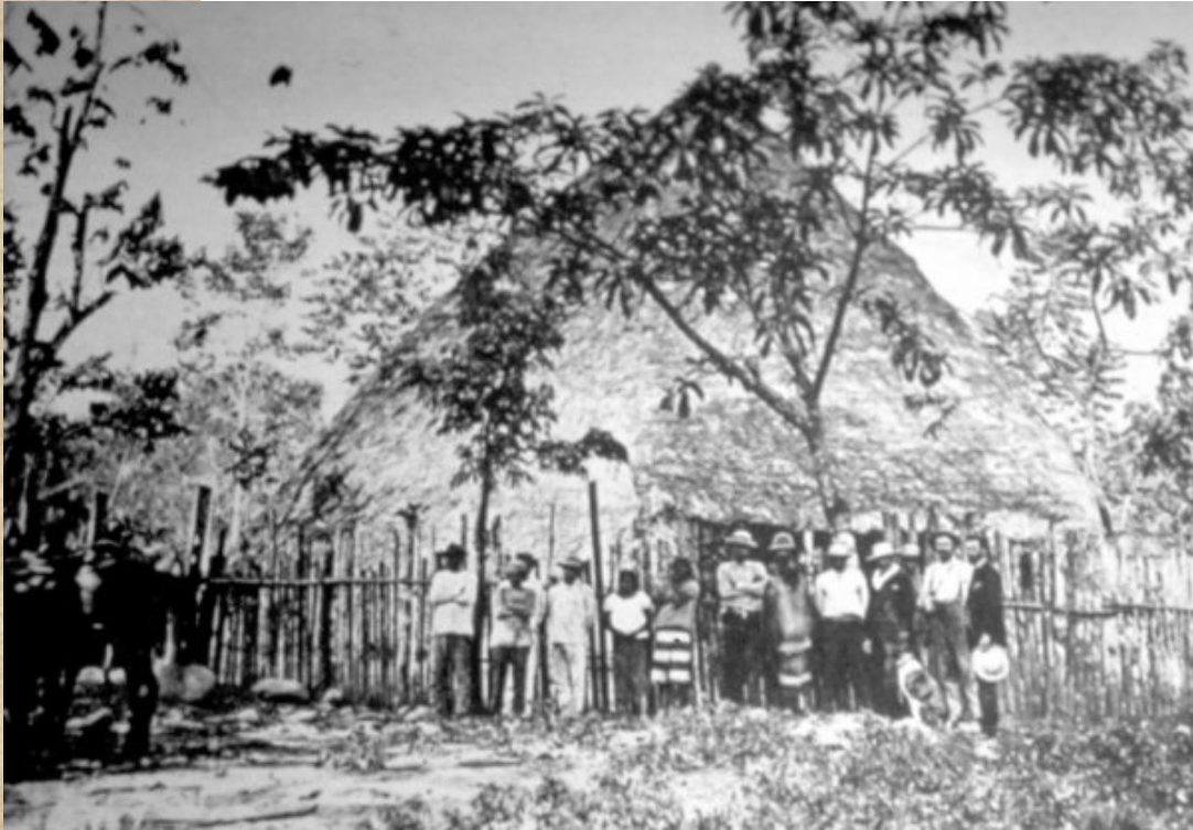
Indígenas Talamanca, 1892.