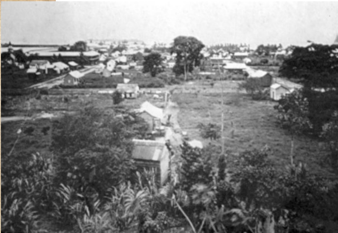
Puerto Limón, 1890.