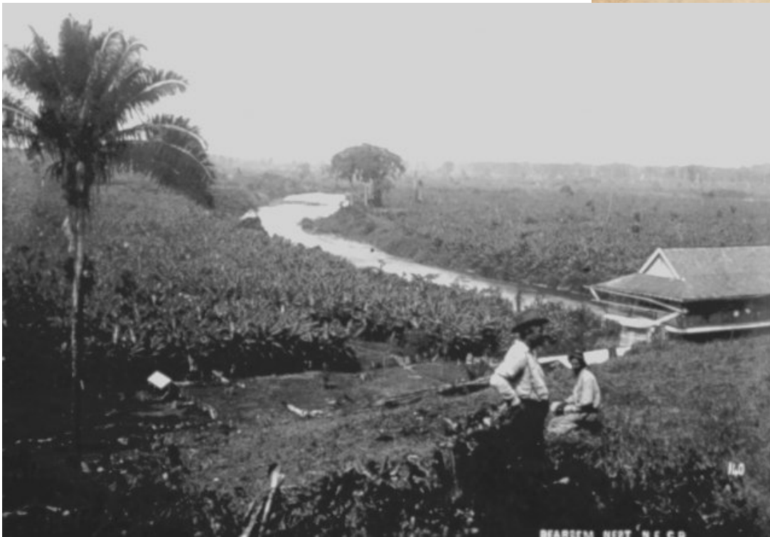
Plantaciones de banano, Limón 1890. Álbum Harrison Nathaniel Rudd, Colección CIHAC.