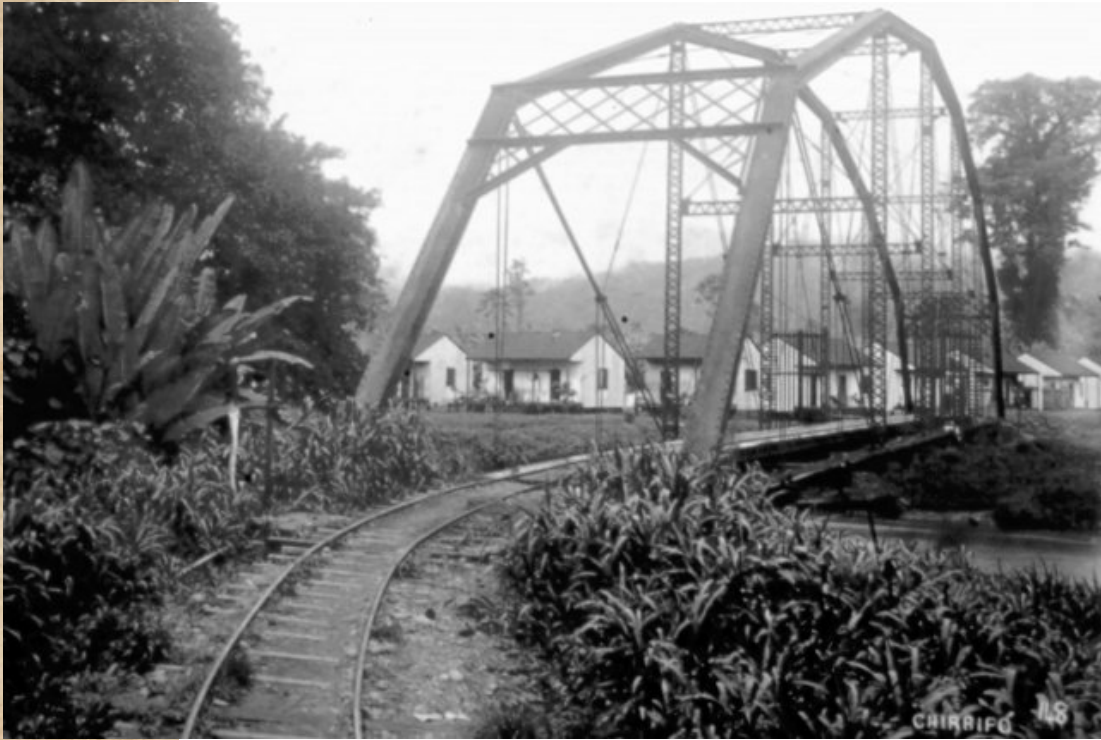
Puente sobre el río Chirripó, Northern Railway Company.