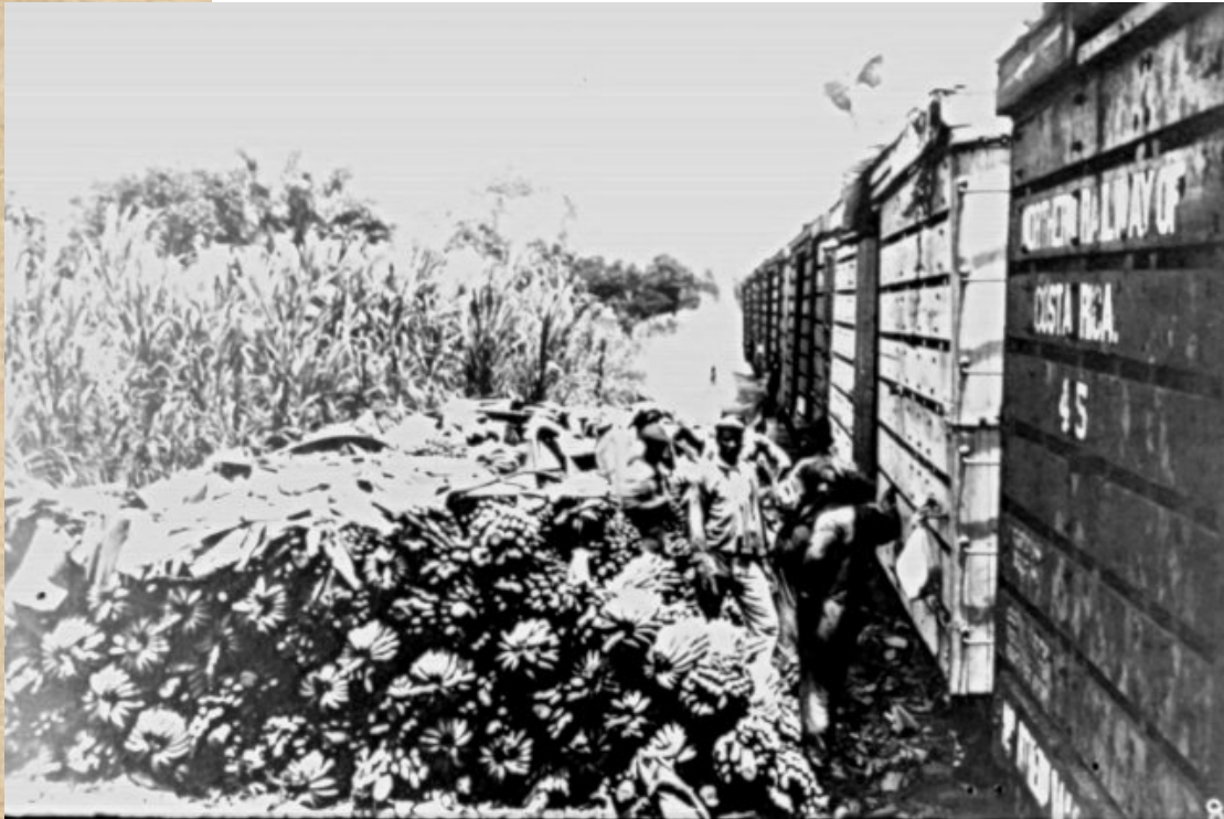
Cargando bananos al ferrocarril Northern Railway Company, 1890.