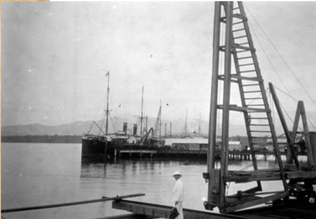
Muelle de Puerto Limón, 1890.