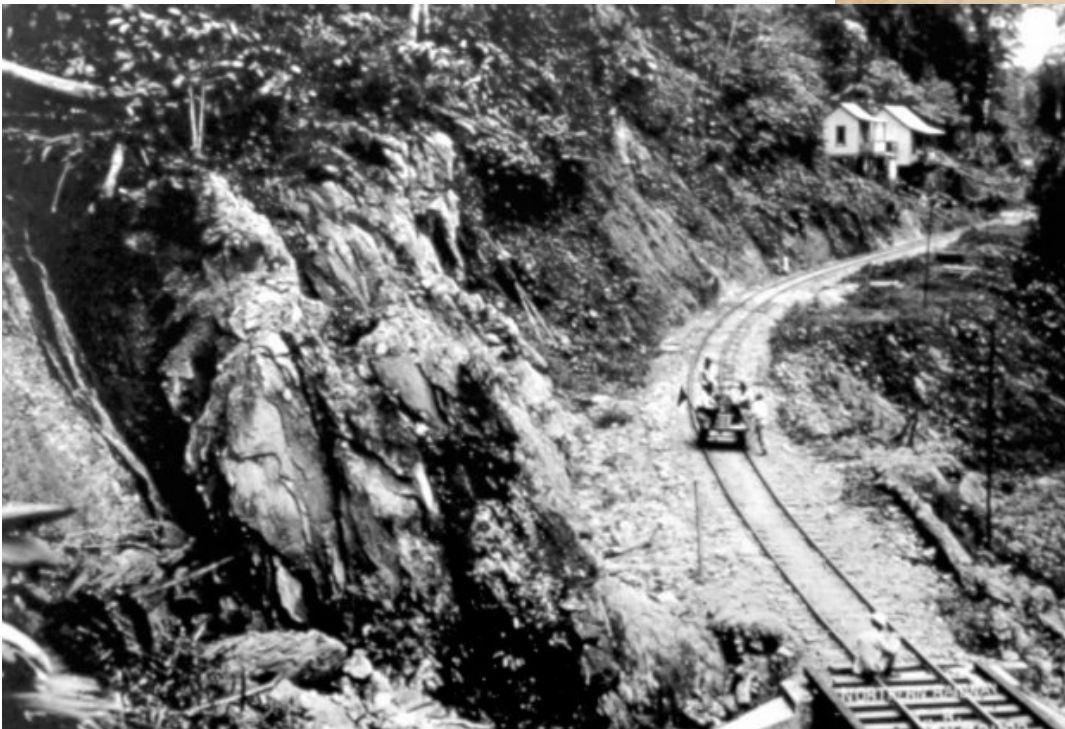
Línea férrea Limón, 1890.