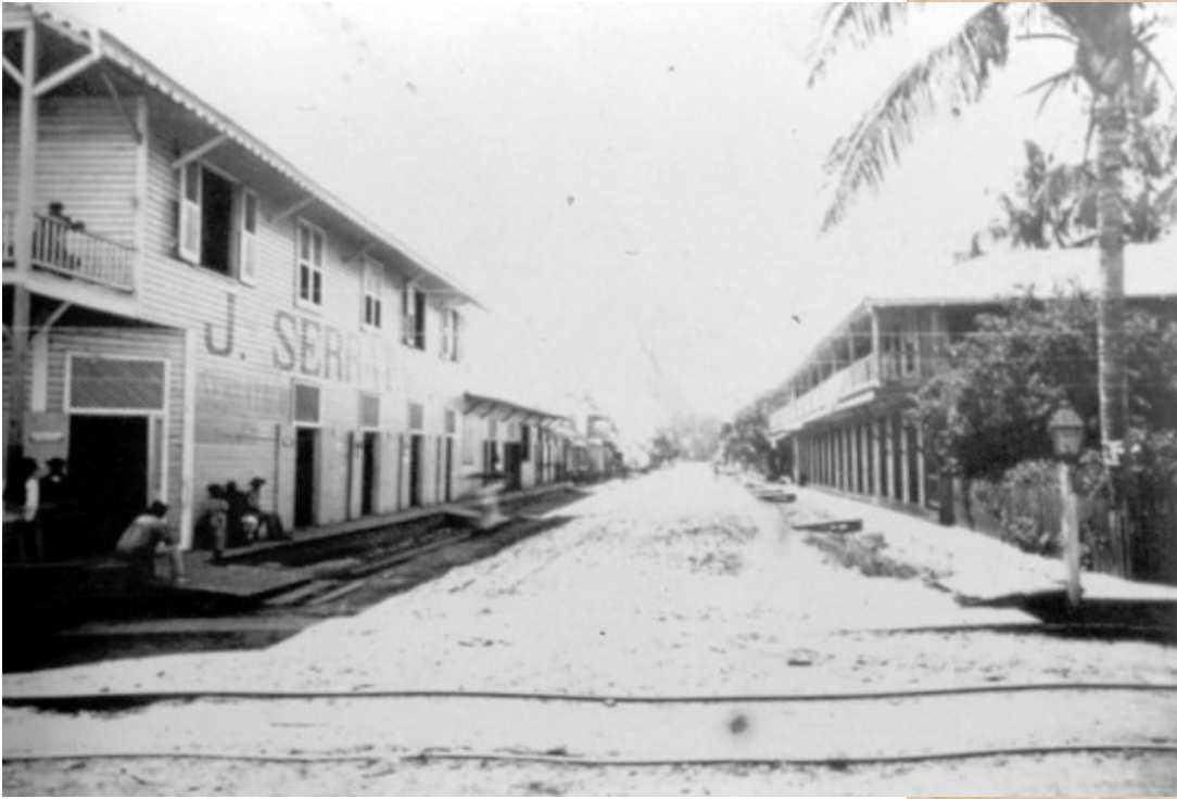
Línea férrea al Atlántico, 1892.