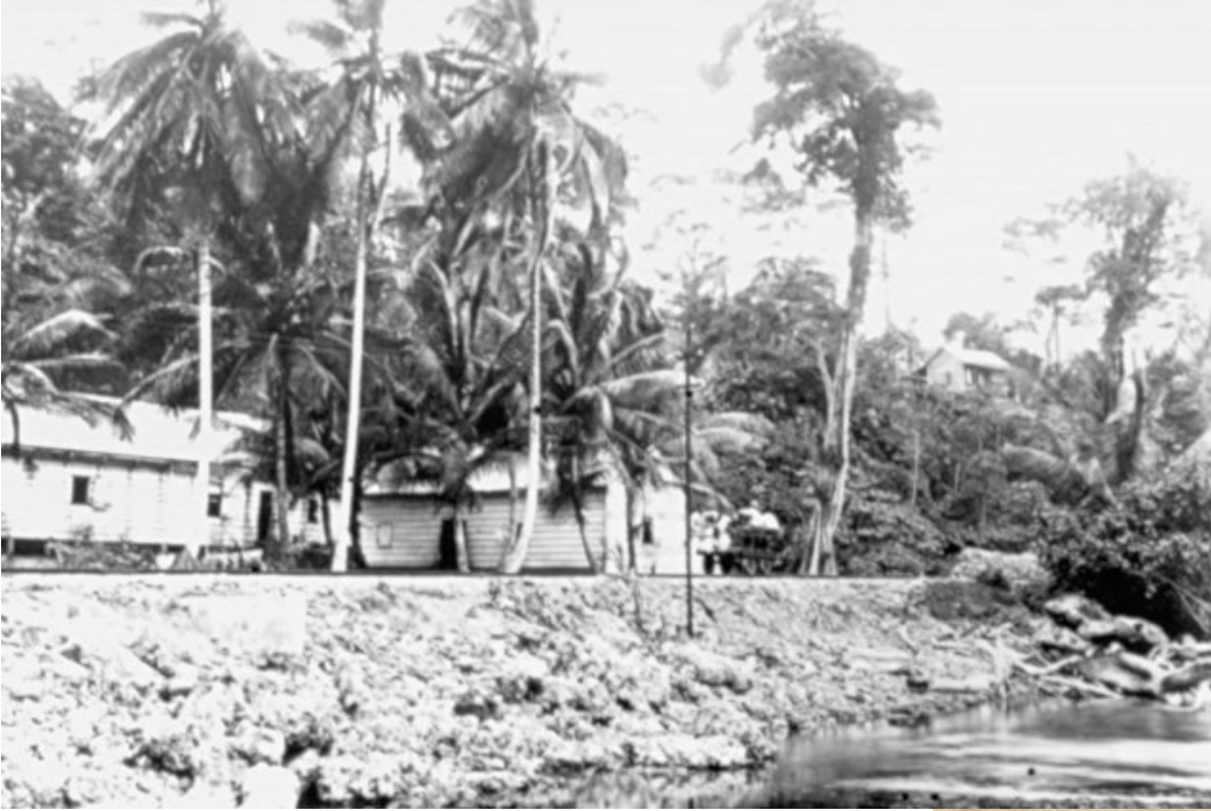
Detalle Puerto Limón, 1890. Álbum Harrison Nathaniel Rudd, Colección CIHAC.