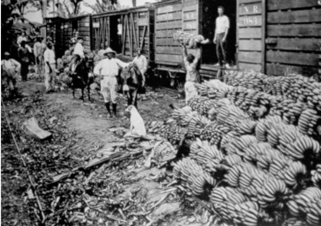
Parismina Banana Company, Limón 1922. Álbum Costa Rica, América Central.