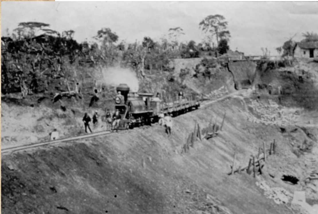
Ferrocarril, 1909.