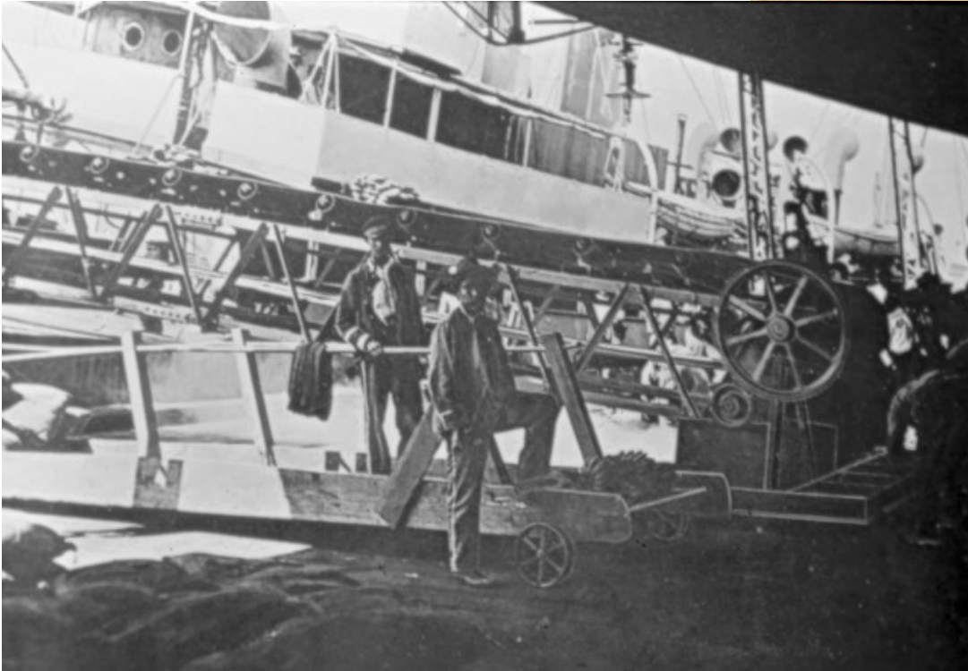
Trabajadores del muelle de Limón, 1909. Álbum Fernando Zamora, Colección CIHAC.