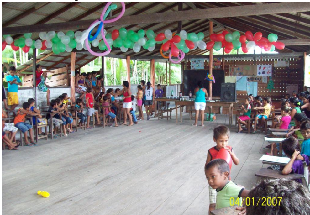
Figura 02 - Sede da Comunidade Menino Deus