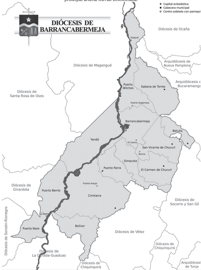
Imagen 1. Mapa de la diócesis de Barrancabermeja, atravesada de sur a norte por el río Magdalena, principal arteria fluvial colombiana.