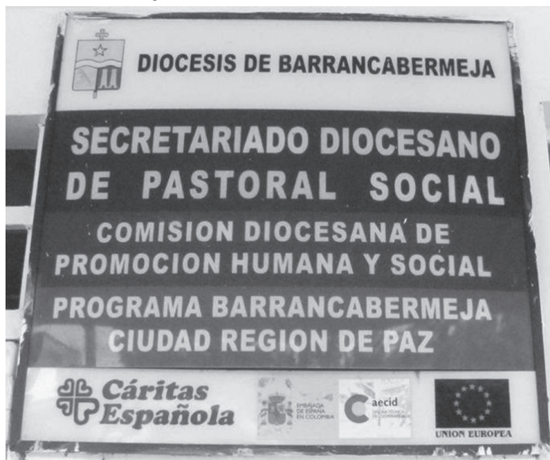
Imagen 2. Aviso ubicado en la portada del edificio de Pastoral Social de la Diócesis de Barrancabermeja.