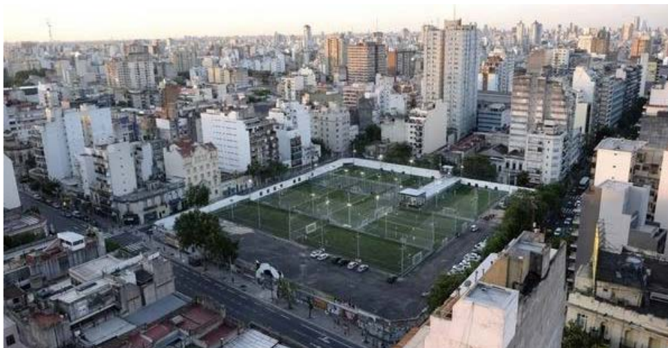
Imagen 5. Vista aérea de las canchas de sintético ya inauguradas