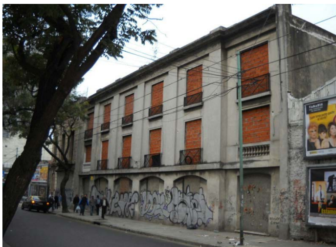
Imagen 2. Los frentes tapiados previo a la demolición