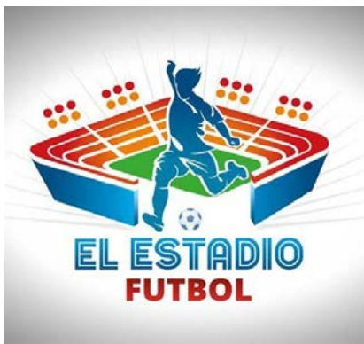
Imagen 6. Logo del predio deportivo construido en la manzana 66