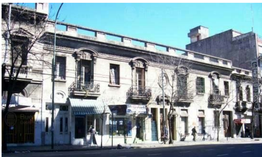
Imagen 1. Las antiguas fachadas de las casas de la manzana 66