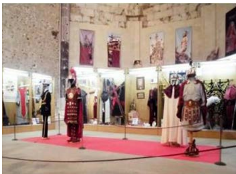
5. Vitrinas con bienes patrimoniales sacros en el Museo de Semana Santa actual en la Iglesia Vieja o iglesia de la Asunción.

Por último, en el exterior de la iglesia, encontramos el atrio, que antiguamente acogía un Vía Crucis con sus correspondientes ermitillas, el cual contiene un nuevo y