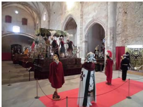
4. Interior del Museo de Semana Santa actual en la Iglesia Vieja o iglesia de la Asunción, Plaza de la Asunción de Yecla.

lado y registro de las nuevas piezas, seleccionadas por los responsables del museo y bajo la modalidad de adquisición de la ordenación, el nuevo museo podrá así conservar, investigar, difundir y exhibir de forma científica y óptima, las colecciones sacras que identifican a la Semana Santa del municipio. (Fig. 4)