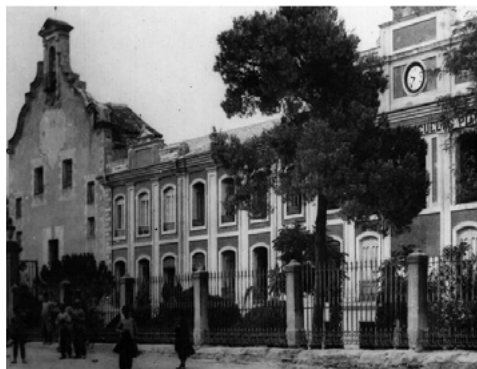
1. Fachada de la iglesia de san Francisco y Colegio de los Escolapios. Archivo Tani, mitad del siglo XX, Camino Real de Yecla (el colegio fue derruido en 1969).

Dentro del planteamiento conceptual del plan museológico de un museo, decir, que el Museo de Semana Santa representará un museo de ámbito local que estará gestionado de forma mixta por dos organismos de naturaleza opuesta, el Real Cabildo de Cofradías Pasionarias de Yecla y el Excmo. Ayuntamiento de Yecla, los cuales velarán por una óptima adquisición, investigación, conservación, difusión y exhibición de los bienes culturales relacionados con la Semana Santa de este municipio murciano, cuyas fiestas fueron declaradas de Interés Turístico Regional en 1990.