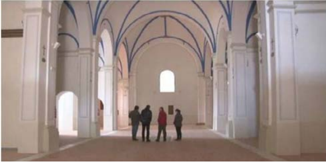
6. Interior de la iglesia de san Francisco de Yecla, Teleyecla, 2014, Camino Real de Yecla.

cronológica y correctamente planificada. Cada uno de los bienes se ubicará dentro de unas vitrinas o espacios de exhibición concretos, que portarán sus respectivas cartelas y paneles expositivos de carácter visible, sencillo y uniforme, como material didáctico complementario, medios audiovisuales en cada capilla para una mayor comprensión del momento sacro que se represente y una ambientación musical religiosa para todo el espacio del museo 17 , entre otros elementos. De esta forma, la exposición refleja ser un fenómeno social y comunicativo, en la que las nuevas tecnologías aumentan y profundizan, cada día más, el diálogo entre el sujeto y el objeto museístico 18 .