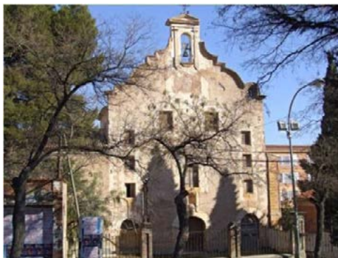
2. Fotografía de la iglesia de San Francisco, Camino Real de Yecla.

Con ello, manifestar, que la temática de dicho museo tendrá como objetivo principal la difusión del mensaje cristiano de la Semana Santa a través de un conjunto de obras y piezas artísticas, creadas a lo largo del siglo XX e inicios del siglo XXI, las cuales serán trasladadas desde el espacio museístico de la iglesia de la Asunción o Iglesia Vieja a san Francisco, pues este museo no dispone de unas condiciones óptimas, ni se encuentra bajo parámetros museís-