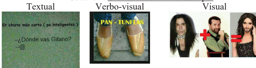
Cuadro 1: Gramática de los memes ‘tipo’.

Tras examinar el corpus de datos reunido, se han advertido una serie de características generales. En relación a la imagen, los recursos iconográficos empleados son diversos; Desde referentes estandarizados de humor –expresiones faciales de niños y niñas–; animales comunes –gatos, perros o monos–; famosos de toda índole –políticos, deportistas, actores, etc.–; e incluso personajes de ficción como Mafalda o Homer Simpson, conocidos y compartidos por una amplia base social. No obstante, también un registro fotográfico disruptivo –caída, carcajada o desconcierto– puede estimular la producción de un meme. Esta última modalidad prolifera en torno a las resonancias informativas sucesos socio-políticos de actualidad (Dyner, 2016: 662).