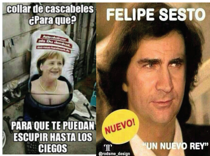
Cuadro 3: Memes con imágenes manipuladas o ficcionadas.

A menudo, se atribuye a este nuevo formato de distribución de humor un potencial inagotable del ingenio creativo, aunque como para el resto de las actividades humanas, una observación sistemática permite advertir redundancias por imitación y/o plagio que implica una duplicación de piezas, con ligeras