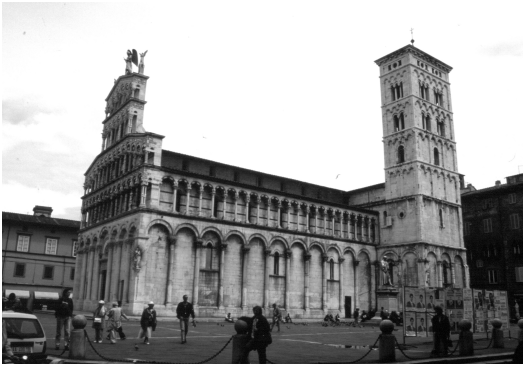
Fig. 3. LUCCA (Italia): Plaza e Iglesia de San Michele.