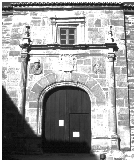
Fig. 5. SANTA MARTA DE TERA: Portada del Palacio Episcopal. (Destacan los medallones del Emperador Carlos V y del Papa Julio III, sucesor del Papa Paulo III). Año 1550.

En cuanto a la Abadía de Santa Marta de Tera, quedó vacante cuando Don Pedro Sarmiento fue designado Obispo de Tuy, y así siguió durante muchos años. Hasta que el Pontífice Paulo III, quizá a petición del Obispo de Astorga unió la Dignidad de Abad de Santa Marta a la Dignidad Episcopal asturicense. Esta decisión la sometió el Pontífice al parecer del rey de España, a la sazón el Emperador Carlos V, como patrono que era de la Abadía. Desde entonces los obispos astorganos ostentaron como título honorífico la Dignidad de Abades de Santa Marta de Tera. 23 (Fig. 5).