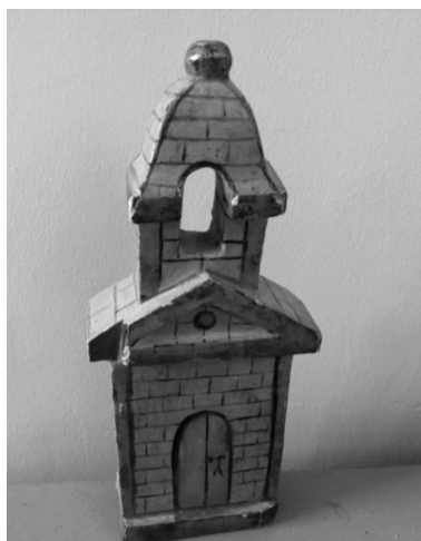
Máqueta en madera de la fachada principal de la ermita de Santa Bárbara