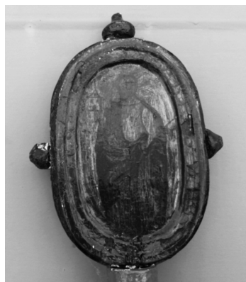
Fig. 4. Cabecera de la vara con la imagen de Santa Bárbara

El veintiocho determina que los clérigos de la cofradía dirán una misa de requiem cantada “e oficiada mui honradamente tambien al pobre como al rico por su ánima” . Todos los clérigos tendrán puesto el sobrepelliz. El heredero del difunto dará a los clérigos