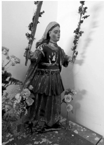
Fig. 1. Imágen de Santa Bárbara, Patrona de la Cofradía

En épocas pasadas las cofradías fueron instituciones religiosas que jugaron un importantísimo papel social y civil. La vida cotidiana de muchas personas y localidades estuvo estrechamente ligada a ellas. Tal es el caso de San Román del Valle, población que, además de con la Cofradía de Santa Bárbara, tuvo estrecha relación con el Santuario de Nuestra Señora del Valle 1 . Las cofradías fueron organizaciones imprescindibles para el funcionamiento de las poblaciones donde se asentaban. Tienen su origen en la Edad Media. Son agrupaciones religiosas laicas que se han desarrollado en zonas rurales fundamentalmente desde la Edad Moderna hasta la actualidad. Las cofradías contaban –y cuentan– con organización y normas estatutarias propias, así como personalidad jurídica particular. Durante los siglos XVI, XVII y XVIII nacieron numerosas hermandades y cofradías por toda Castilla.