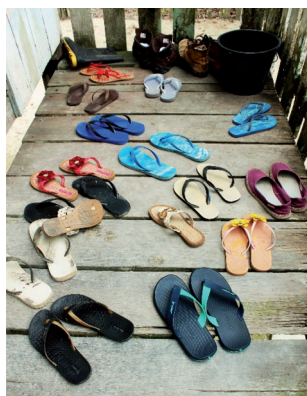
Figura 3: Tirando os sapatos.