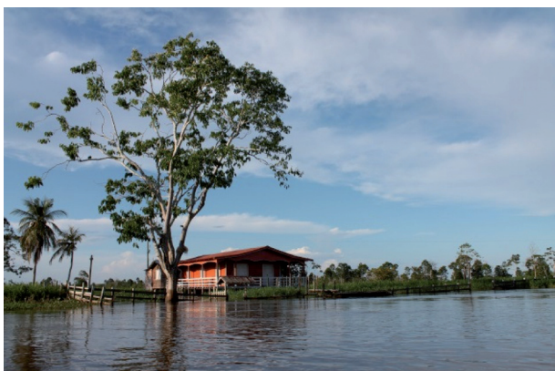
Figura 9: Casa de várzea na cheia, Miracauera, Careiro da Várzea, Laelia Nogueira, Julho de 2014.

Muitas vezes a casa nem chega a ser desmontada, ela tem seus esteios cortados e essa é transferida através de uma espécie de trilho de madeira para mais distante da beira diminuindo o risco de desabar junto com a terra que cai. Em caso de serem pegos desprevenidos e perderem suas casas o caboclo se ergue novamente como diz Alberto Rangel (p. 70, 2008), “No dia seguinte, a vítima era um vencedor, plantando no chão, no alto da terra caída, o esteio de sua nova habitação”.