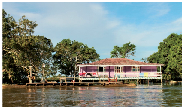
Figura 7: Casa. Miracauera Careiro da Várzea, rio Solimões.

gura 06 e também na Figura 7, as tábuas de madeira utilizadas são em geral dispostas na horizontal, devido ao seu encaixe macho-fêmea. Essas madeiras são normalmente compradas já com os cortes e encaixes, e não retiradas diretamente da natureza por seus moradores.