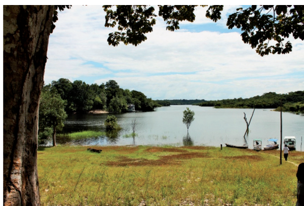
Figura 18: Frente da casa de dona Inês.

A paisagem a qual me refiro quando falo de dona Inês é a imagem a baixo: