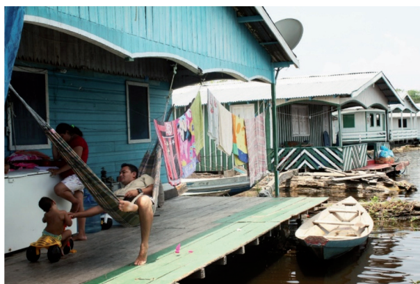
Figura 12: Casa flutuante, a vida sobre as águas.

Esse é mais um exemplo de como a paisagem está ligada à maneira do homem de habitar, no Amazonas pode-se encontrar comunidades inteiras somente de flutuantes, onde, como na imagem a cima (Figura 12) a vida acontece sobre as águas, banheiros e barcos.