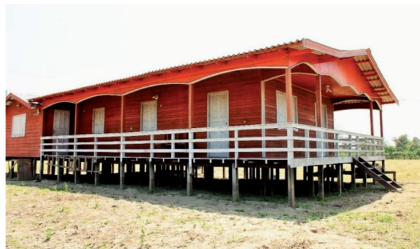
Figura 8: Casa de várzea na seca Miracauera, Careiro da Várzea, Laelia Nogueira, setembro de 2014.

A casa é desmontada, mas jamais completamente desfeita, visto que a nova casa que irá se erguer é sempre quase idêntica à anterior, demonstrando afeto pela casa, consequentemente a importância simbólica daquela estrutura. Os que podem, melhoram-na com outra pintura ou uma pequena ampliação, mas em geral a disposição dos ambientes ou sua forma, permanecem a mesma da anterior. Nas imagens abaixo (Figura 8; Figura 9) podemos ver a diferença entre os níveis da água na cheia e na vazante: