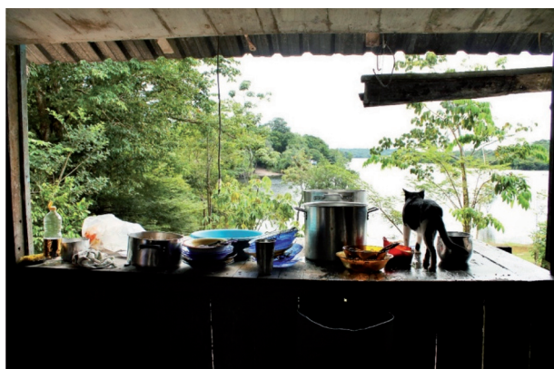
Figura 16: O Jirau; Rio Cuieras. Foto: Laelia Nogueira, Janeiro de 2014. Esse espaço é sem dúvida um dos mais interessantes das casas. Essa área de lavagem, é uma linda abertura para o lado externo da casa, representando juntamente com as varandas a ligação entre interior e exterior.

O piso é de extrema polidez e a quantidade de redes abundante, em geral recebem tratamento com cera de abelha e duram incontáveis dias. O jiral, constitui-se em uma das maiores marcas da casa ribeirinha, é por ele que a paisagem invade a casa, e permite ao morador um momento diário de contemplação. Essa abertura, em geral localiza-se na cozinha e é utilizado como bancada de pia, onde se lava a louça e se trata o peixe.