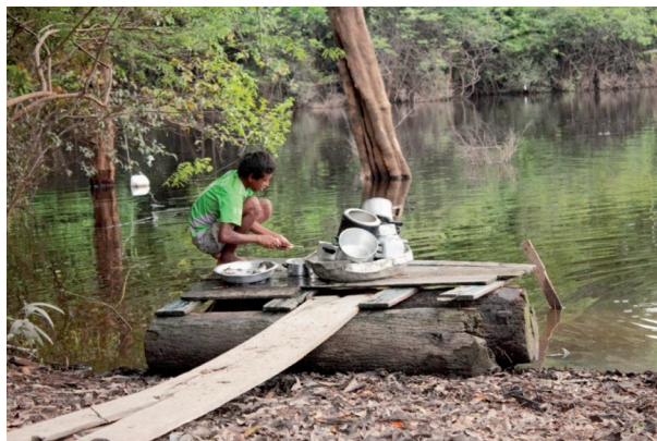
Figura 5: Menino lavando louça. Autor: Laelia Nogueira, Rio Cuieiras Maio 2015.

percebemos um garoto executando a tarefa de lavar louça. Essa tarefa, entretanto, não é feita do lado de dentro da casa, mas sim fora, na beira do rio, sobre um suporte de maneira que pode ser chamado de “jirau”, nos mostrando como a casa ultrapassa as paredes da própria construção e a casa deixa de ser meramente uma construção para se tornar o mundo inteiro.