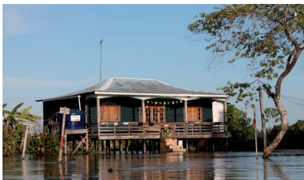
Figura 6: Casas “de campo”, Miracauera, Careiro da Várzea, Laelia Nogueira, Julho de 2014.

A casa a cima (Figura 6) é uma casa localizada na comunidade do Miracauera, localizado em área de várzea no município do Careiro da Várzea. Essas casas são casas denominadas pelos moradores como “casa de campo”. Ao observá-las e pensarmos nesse nome podemos facilmente relacioná-las com uma casa típica da colonização portuguesa, que se espalhou por todo o Brasil, inclusive, vemos isso fortemente quando observamos sua planta-baixa.