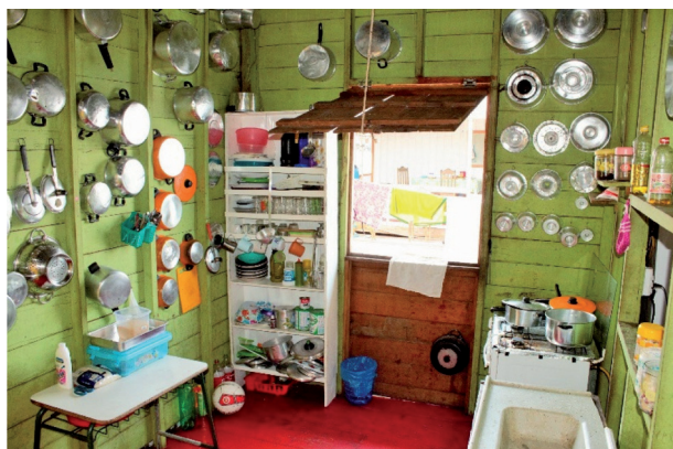
Figura 15: Cozinha do flutuante da dona Raimunda. Encontro das águas Laelia Nogueira, Setembro de 2014.

tos convidados forem possíveis, sendo a cozinha muitas vezes o coração quente da casa.