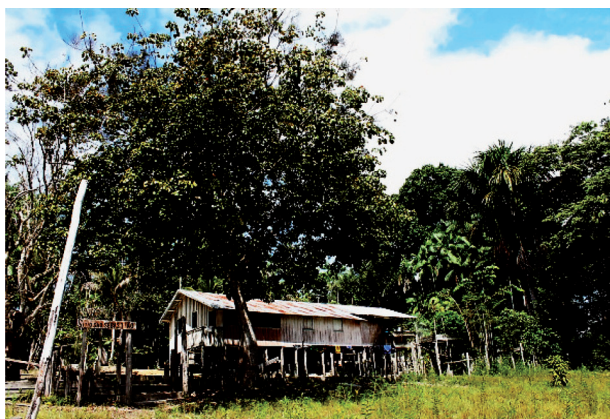
Figura 13: Casa de terra firme. Rio Cuieiras, período intermediário, janeiro 2014.

Além desses, podemos exemplificar a casa de terra firme (Figura 13). Como observamos na imagem a cima, a casa de terra firme possui a mesma simetria que a casa de várzea, porém percebemos que suas tábuas estão posicionadas na vertical. Assim como na várzea isso representa a compra da madeira, na terra-firme representa sua extração. Nessa região, boa parte da população ainda vive de extrativismo conhecendo, portanto, os mais diversos tipos de plantas da região e sabendo exatamente quais as melhores propriedades de cada uma delas e quais devem ser usadas em quais partes que compõe a casa como descrito por seu Chiquinho, morador de uma comunidade no rio Cuieiras: