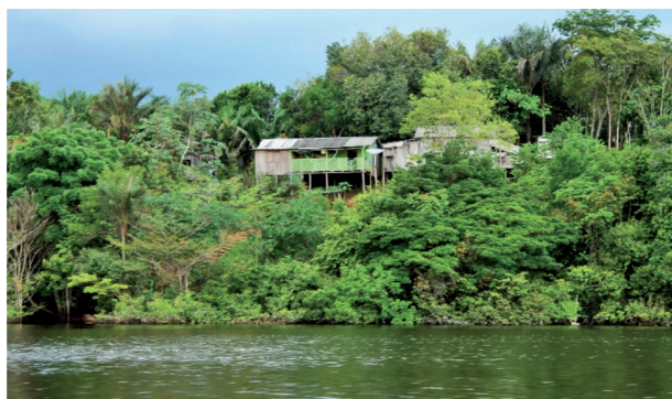
Figura 1: Casa e floresta se misturam, uma não é sem a outra. Fonte: Laelia Nogueira, Rio Cuieiras, terra firme, 2015.

(...) a paisagem não é, em sua essência, feita para se olhar, mas a inserção do homem no mundo, lugar de um combate pela vida, manifestação de seu ser com os outros, base de seu ser social. (...) Uma verdade emerge da paisagem, contudo como teoria geográfica ou mesmo como valor estético, mas como uma fiel expressão da existência. (...) A paisagem pressupõe uma presença do homem, mesmo lá onde toma forma de ausência. Ela fala de um mundo aonde o homem realiza sua presença circunspeta e atarefada. (DARDEL, p. 32, 2011)