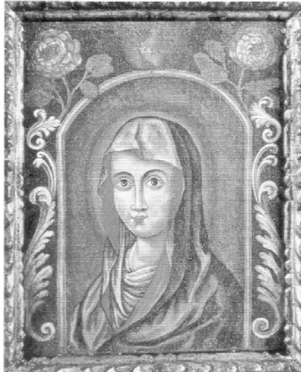
Figura 1. Retrato de la Virgen. Óleo sobre tela

Fuente: Complejo Museográfico “Enrique Udaondo” (Luján, provincia de Buenos Aires). Cortesía Darko Sustersic.