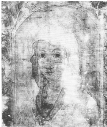
Figura 2. Dibujo subyacente de la Virgen de Habiýú aparecido a través de rayos infrarrojos detectados en la restauración de la Fundación Tarea