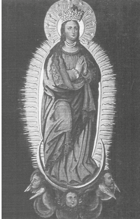
Figura 3. Imagen de la Inmaculada Concepción o Señora de los Milagros, actualmente. Óleo sobre tela