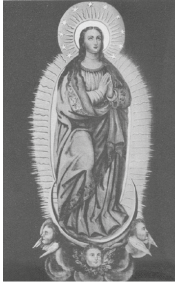
Figura 4. Imagen de la Inmaculada Concepción o Señora de los Milagros antes de los agregados