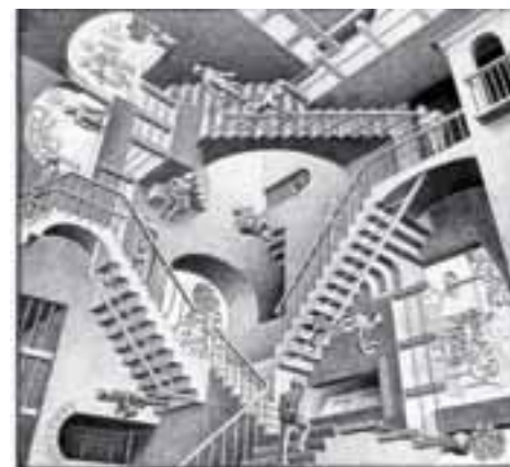
Figura nº 2: Lo que creemos que estamos haciendo al hacer ciencia.

A partir del siglo XX, se desarrolló un lenguaje basándose en el lenguaje de la Física, un método deductivo y basado en el positivismo, una filosofía de la Ciencia, vinculada con la Lógica y el empirismo inglés, con criterios basados en la verificación, la replicación y la confirmación. De esta manera, surge en una segregación entre los que hacen una ciencia con estos criterios y entre los que lo fundamentan con otros tipos de juicios. Así se llegó a caracterizar el conocimiento entre el que se denominaba "científico" y el "humanístico". Sin embargo, el conocimiento no logró el alcance esperado y siguen existiendo inconsistencias y refutaciones.