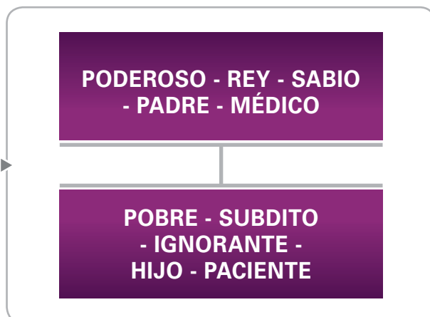
Figura 2. Paternalismo.