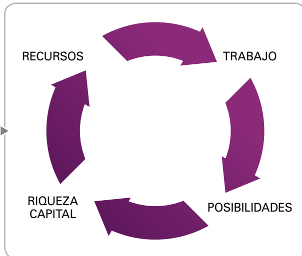
Figura 4. Proceso para obtención de Capital

El conflicto de esta forma de producción se presenta cuando una acción puede ser eficiente para la persona que la realiza, pero termina siendo ineficiente para otros individuos involucrados en el proceso, viéndose afectados por esto. Dentro del proceso de optimización de la producción se puede hacer que otros asuman la relación costo –beneficio. Esto generaría unos rendimientos por debajo de lo considerado como recomendable.