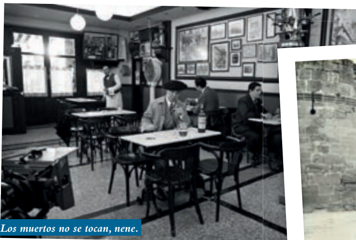
Los muertos no se tocan, nene.