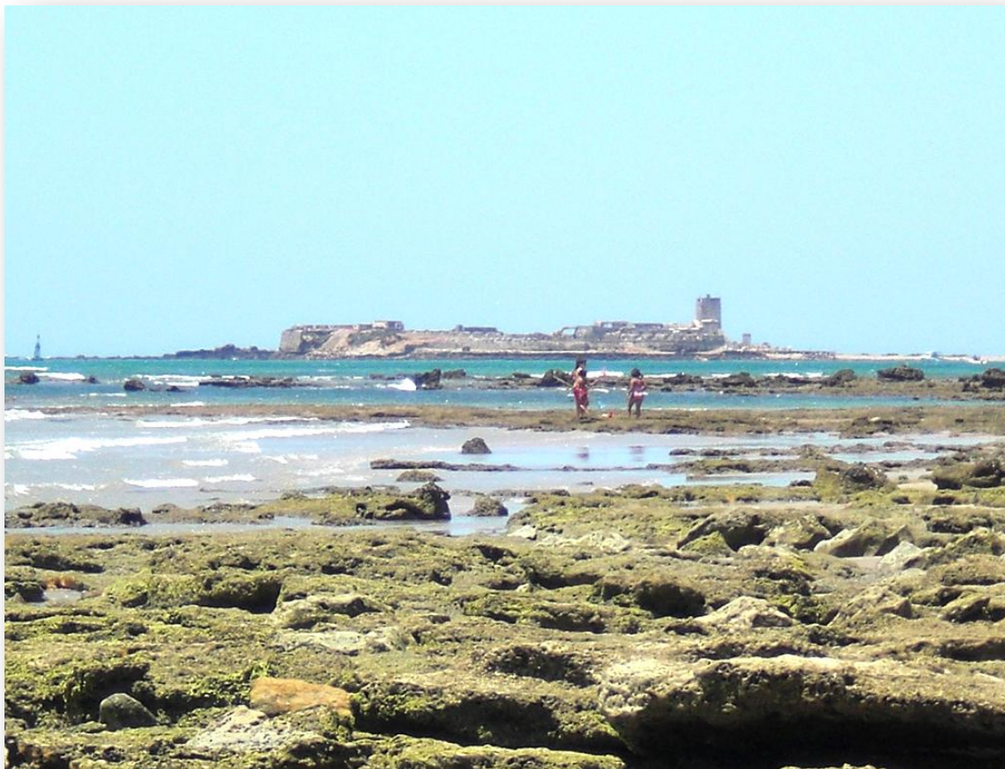
Castillo de Sancti-Petri desde la Playa de la Barrosa (Chiclana).

Interés Cultural, figurando correspondientemente en el Catálogo General del Patrimonio Histórico Andaluz.