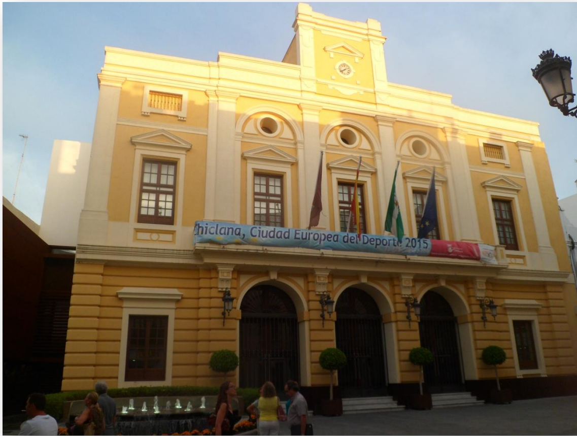
Ayuntamiento de Chiclana. Portada principal.