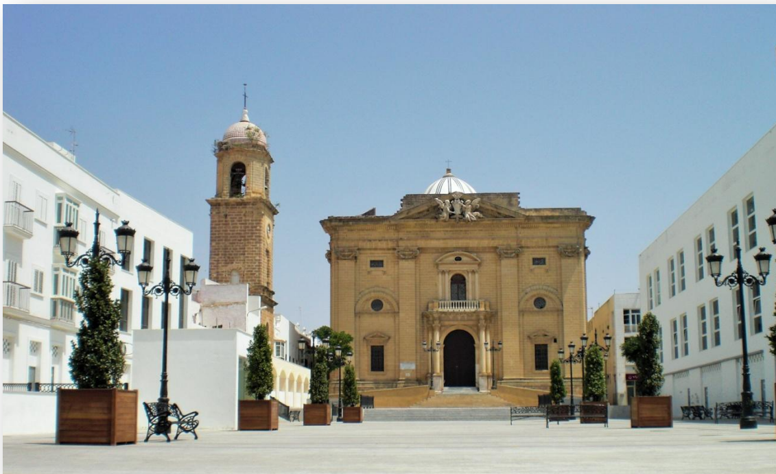
Iglesia Mayor o Iglesia de San Juan Bautista.

Centrándonos en este edificio, cabe mencionar los distintos avatares del proceso constructivo. Ideada por el afamado Arquitecto Torcuato Cayón de la Vega –maestro, tío y padrino de Torcuato José Benjumeda y Laguada-, en sus manos se desarrolla el proyecto durante siete años, hasta su muerte en 1783. Retoma la obra Benjumeda, dándose por concluida –pese a que ciertos elementos estructurales como las torres proyectadas no se llegan a ejecutar-, después de episodios como la invasión francesa o diversas epidemias, todo lo cual ralentiza la construcción del que será, a pesar de todo, tal y como atestigua el Prof. Falcón Márquez, el templo neoclásico cardinal del entorno de la Bahía, y uno de los más importantes de la región andaluza.