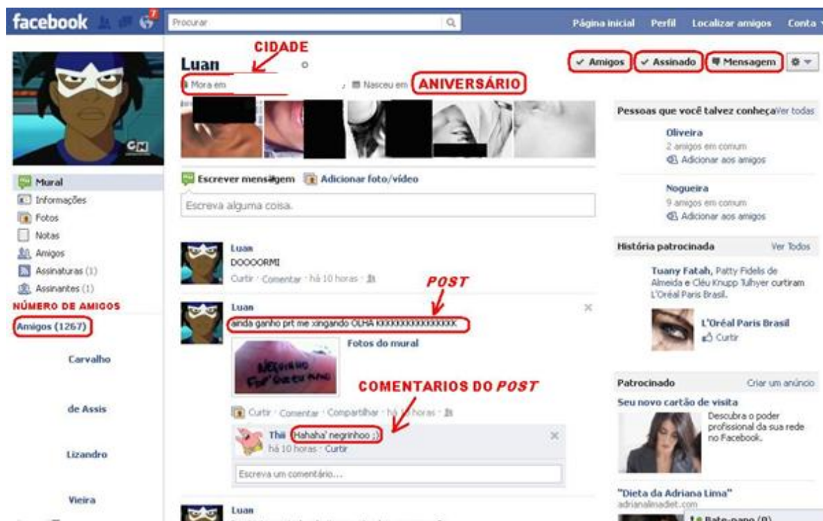
Figura 3- Mural de Luan na rede social Facebook

A seguir apresento o mural do Facebook de Luan e faço outras observações a respeito da construção de suas performances .