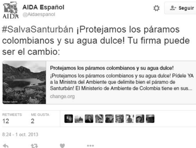
Figura 1. Tuit AIDA: Páramo de Santurbán

Asimismo, la Asociación Interamericana para la Defensa del Ambiente (AIDA, 2014) promovió dos campañas lanzadas el 1 de octubre de 2013, presentadas en el microblog Twitter (Aidaespanol, 2013), creando el hashtag #SalvaSanturbán, para proteger el Páramo de Santurbán. No obstante, el impacto de este tuit no tuvo suficiente trascendencia, interpretada desde la medición, ya que se generaron apenas 12 retuits y 2 me gusta (ver figura 1). Sin embargo, a partir del 1 de octubre de 2013 y hasta el 26 de mayo de 2016 los tuiteros, entre la sociedad civil y organizaciones no gubernamentales (ONG), publicaron 122 entradas con el hashtag en mención.