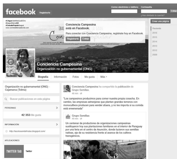
Figura 4. Página de seguidores de Facebook: Conciencia Campesina

Esta es una organización que surge del campesinado agrícola, quienes logran comprender que una mina como La Colosa, a cielo abierto, que se implementa e irrumpe su territorio, genera graves conflictos ambientales y sociales que no solo transforman su vida cotidiana, sino que terminarán por desplazarlos del territorio. Con esta clara visión, los campesinos han logrado integrar a su resistencia un innumerable grupo de activistas nacionales e internacionales, entre los cuales nos encontramos quienes participamos en esta Investigación Acción Colectiva.