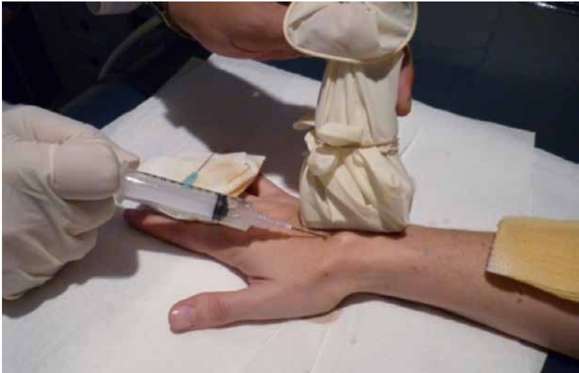
Figura 2. Imagen del procedimiento.

de edad de 31 años (rango de 21 a 48). Se evaluaron 15 muñecas derechas y 17 muñecas izquierdas. En 19 (59,3%) pacientes, el ganglión estaba en el miembro dominante. En todos los casos, el ganglión se encontraba sobre el ligamento escafolunar. Ningún paciente hacía trabajos pesados ni forzados, ni deportes de impacto; las ocupaciones eran las siguientes: 14 (43,75%) telefonistas que trabajaban en un call center, 6 estudiantes (18,75%), 5 amas de casa (15,62%), 2 secretarías (6,25%), 2 abogadas (6,25%), una médica (3,12%) y un radiólogo (3,12%). El promedio del tamaño de los quistes fue de 17,6 mm (rango de 10 a 26 mm) de longitud por 12,8 mm de ancho (rango de 8 a 18 mm). Se utilizaron dos tipos diferentes de aguja según si la mucina era más bien líquida (aguja fina Terumo® de 23 g x 25 mm) o consistente (aguja Neojet® de 18 g x 50 mm). Antes del procedimiento, los pacientes refirieron un promedio de 7,75 puntos en la escala de dolor (rango de 6 a 9) y el puntaje DASH promedió 2,90 (rango de 2,02 a 3,86). Diecinueve (59,37%) no tenían ninguna cirugía previa (grupo 1) y 13 (40,62%) ya habían sido sometidos a un procedimiento invasivo (grupo 2) y la recidiva había sido diagnosticada por ecografía. A todos, se les indicó retornar a sus actividades y tareas habituales al día siguiente del procedimiento.