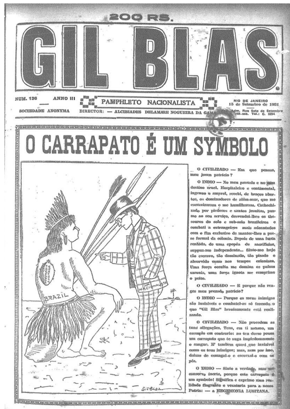
Figura 3 Gil Blas , “Capa”, 15/9/1921, nº 136, Ano II.

Em termos de imagem é interessante cotejarmos a capa da revista “O carrapato é um symbolo” (abaixo) com as denúncias da hegemonia dos capitais portugueses no Brasil. Nessa caricatura evoca-se a ideia de uma relação parasitária, em que o português aparece como “sanguessuga” da população e dos recursos brasileiros.