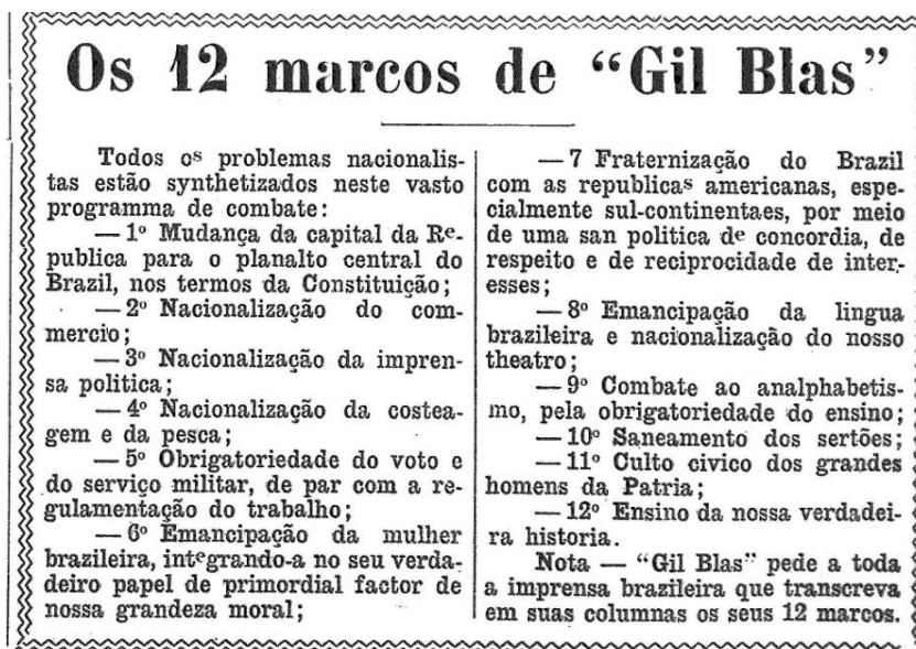
Figura 2 Gil Blas , 2/9/1920, nº 82, p. 11.

Todos os marcos foram devidamente apresentados em conferência realizada por Alcebíades Delamare, diretor e redator da Revista, no salão da Biblioteca Nacional do Rio de Janeiro, na noite de 10 de setembro de 1920. Dedicar-nos-emos a contextualizar alguns dos pontos do programa relacionados às ideias antiestrangeiras e antilusas.