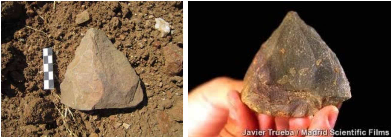
A la derecha punta protomusteriense aparecida en los alrededores de Villafranca de los Barros. A la izquierda la hallada en el nivel TD10 de Gran Dolina de Atapuerca.

que ha dado alguno de los hallazgos más importante en este campo. Pues si analizamos algunas de las herramientas aparecidas en este yacimiento, vemos algunas similitudes con algunas de las halladas en nuestra localidad, como una punta aparecida a unos 4 kilómetros al sur de Villafranca y que es similar, tanto estética como tecnológicamente, a una hallada en el denominado nivel TD10 de la Gran Dolina de Atapuerca.