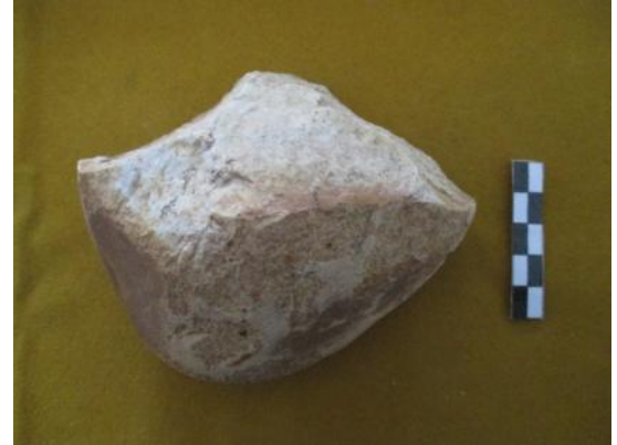
Primera de las herramientas líticas halladas.

Fue en este entorno, entre viñedos y olivos propios de esta zona de Tierra de Barros, en el que apareció la primera herramienta lítica tallada en la primavera de 2013. Se trataba de un canto de cuarcita redondeado similar a los que aparecen en las cuencas de los ríos, pero este era distinto, aunque estaba muy colmatado por el sedimento arcilloso de la zona, presentaba lo que parecían diferentes extracciones en uno de sus lados, muy presumiblemente intencionales, que parecían buscar un filo cortante.