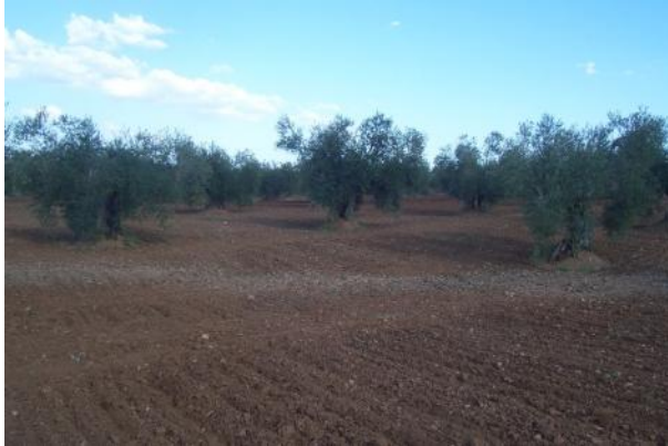
Lugar en el que aparecieron las primeras herramientas líticas.

La naturaleza en general y el campo en particular siempre han dado sorpresas a la Arqueología. Conocidas son las diferentes formas de crecimiento vegetal en zonas en las que soterradas existen construcciones y que los arqueólogos siguen a la hora de hacer investigaciones sobre un territorio por ejemplo.