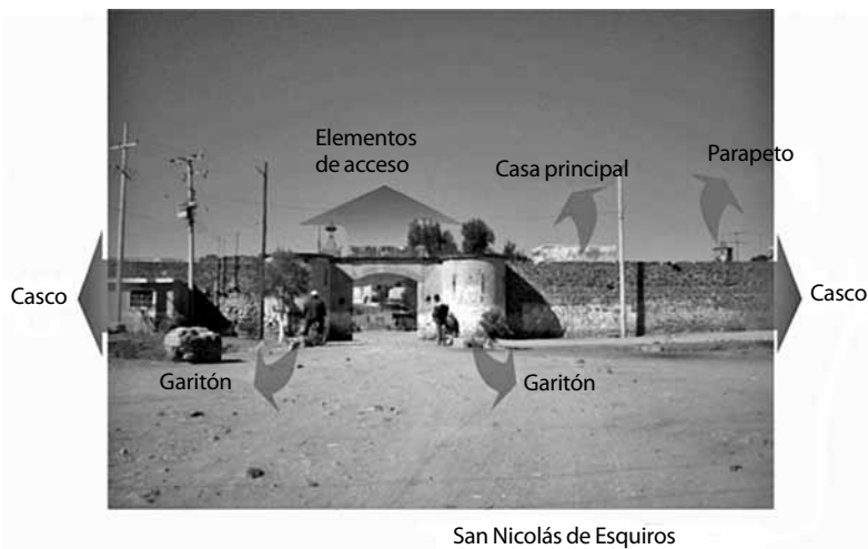
FIGURA 2. Se muestra el acceso al interior de la comunidad, los elementos principales de la original hacienda y la apropiación del espacio