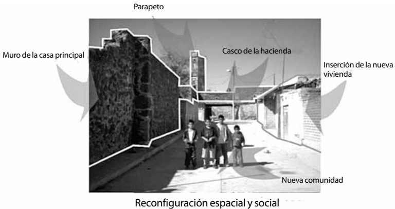
FIGURA 3. La comunidad en el interior del casco de la hacienda. Las formas antiguas conviviendo con las viviendas actuales