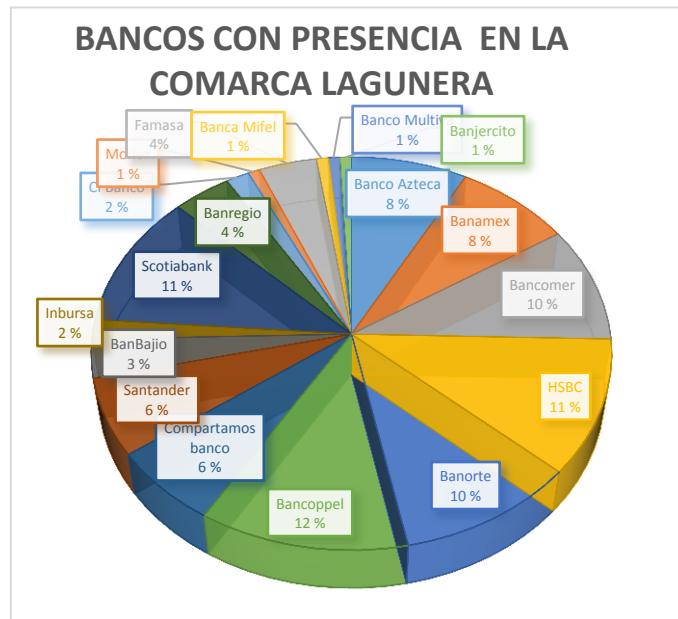
Figura 6. Bancos en la Comarca Lagunera